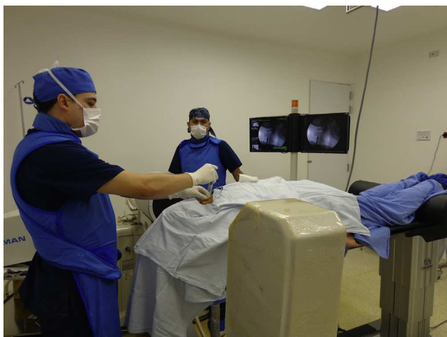
Figura 2 – Inyección epidural cervical en prono guiado por fluoroscopia.