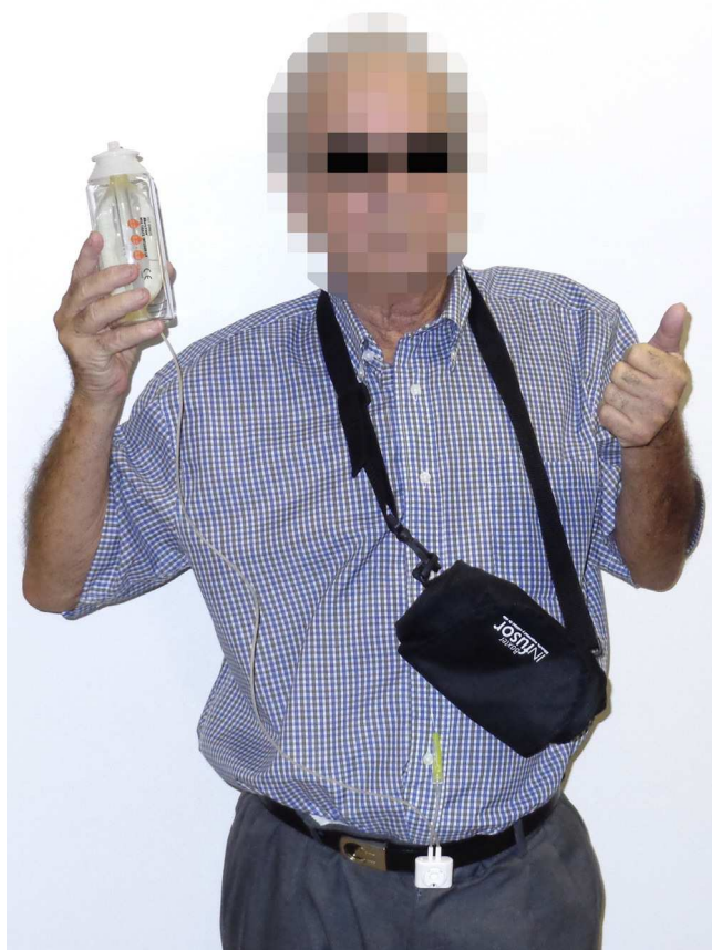
Figura 5 – Bomba elastomérica para infusión epidural cervical ambulatoria.