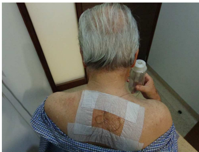
Figura 4 – Catéter epidural cervical tunelizado.