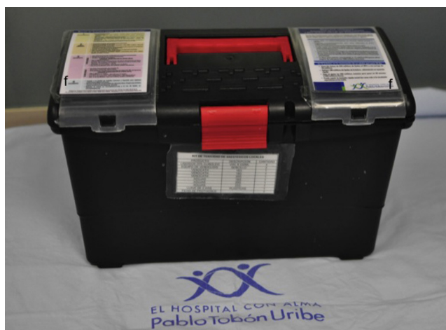
Figura 2 – Kit de toxicidad por anestésicos locales del Hospital Pablo Tobón Uribe. Nótese la facilidad de transporte, así como la inclusión de la ficha técnica (f) y el protocolo de toxicidad por anestésicos en la parte superior, para facilidad de consulta en situaciones de urgencia.

El kit (fig. 2) cuenta con emulsión lipídica al 20% (250 mL) en 4 bolsas, basados en la sugerencia de Marwick et al. 51 de disponer de una dosis total de 1.000 mL en el momento de su empleo, ante la posibilidad de recurrencia de la inestabilidad cardiovascular luego de haber logrado revertir el cuadro inicial. El kit tiene también una llave de 3 vías, 2 jeringas luer-lock de 50 mL, equipos de venoclisis y de canalización de acceso intravenoso y la ficha de protocolo. El kit tiene un costo aproximado de 400.000 pesos. Disponemos de una emulsión lipídica que contiene por cada 100 mL aceite de oliva refinado 80% y aceite de soja refinado al 20% (fig. 3). Esta emulsión debe estar protegida de la luz, almacenarse a temperaturas menores a 30 °C, no refrigerarse y agitarse antes de usar.