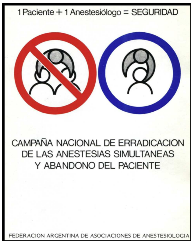
Figura 2 – Campaña Nacional contra las Anestias Simultáneas. Asociación Mendocina de Anestesiología, 1987.