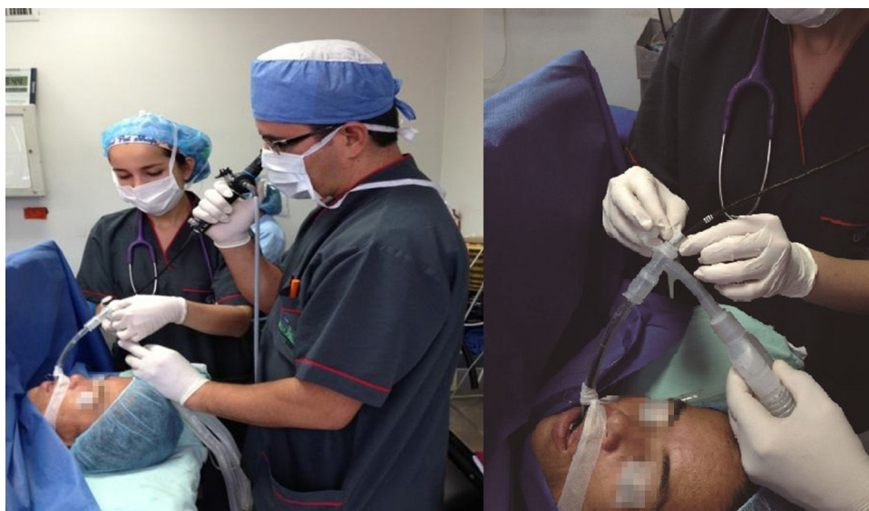
Figura 2 – Técnica de medida. Colocación de cinta adhesiva (micropore), previa determinación directa de las distancias predeterminadas.

con el software SPSS v 15.0 con licencia para la Universidad de Caldas.