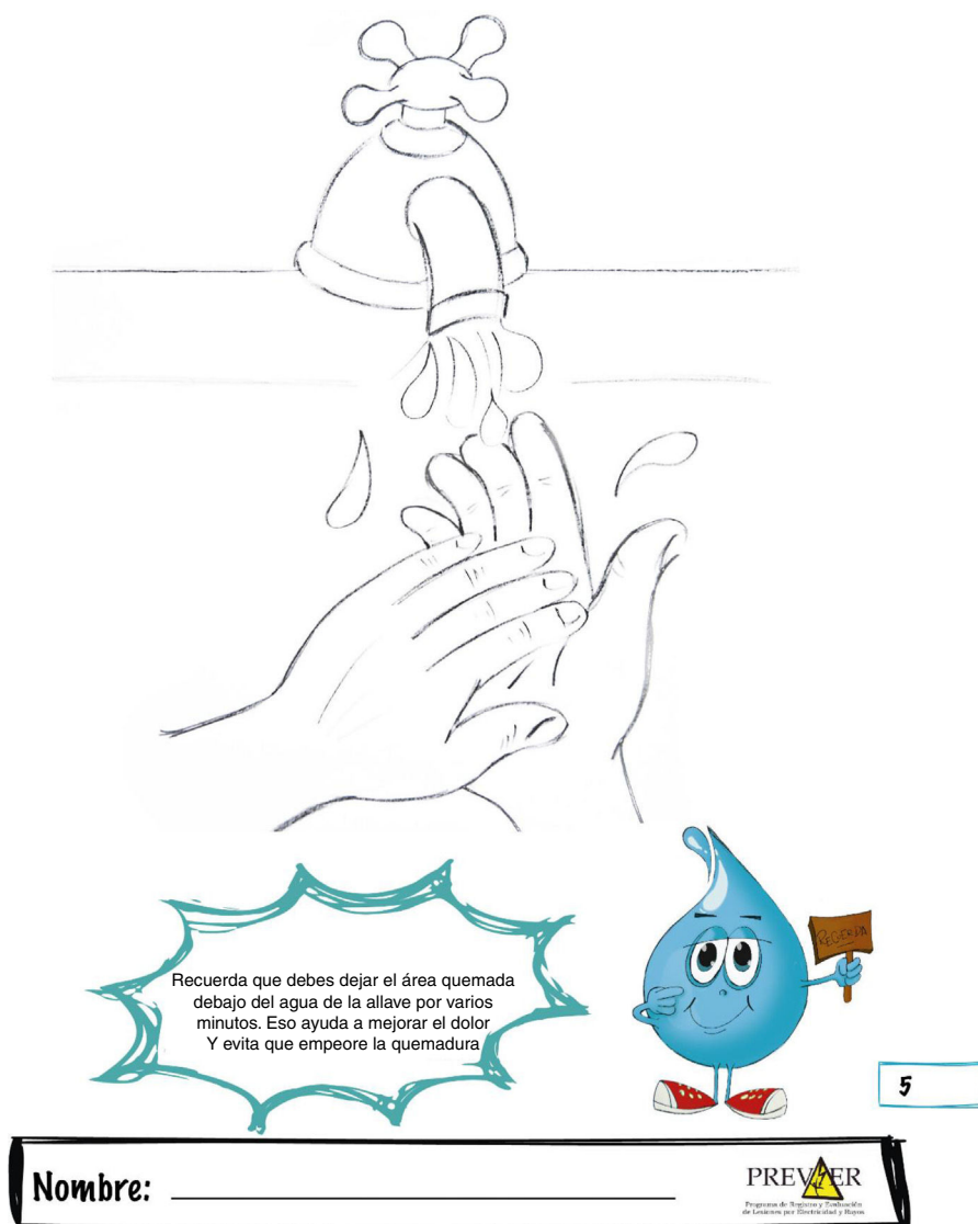
Figura 3 – Apartado de la cartilla del «Programa para la Prevención de Quemaduras con Intervención en la Etapa Pre-escolar». Complemento actividad del segundo día.

La intervención debe ir dirigida a la población más vulnerable y a los involucrados en su cuidado 43 . Esta tiene que ser tanto activa como pasiva, cubriendo las áreas de riesgo más relevantes y el perfil epidemiológico de la población, haciendo énfasis en los mecanismos de lesión repetitivos y en la importancia de un constante proceso de educación 44 .