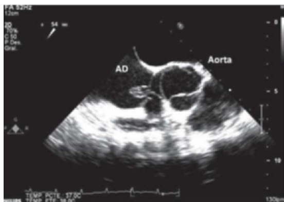
Figura 1. Aneurisma del seno de Valsalva no coronario con ruptura a aurícula derecha. Vista ecocardiograma transesofágico bidimensional (AD: aurícula derecha).

La ecocardiografía bidimensional, el Doppler y el Doppler color son buenos métodos diagnósticos para su identificación (20, 21), además de ayudar a la detección de anomalías asociadas. La ecocardiografía tridimensional en tiempo real surge como una nueva ayuda diagnóstica cuya utilidad ha sido demostrada