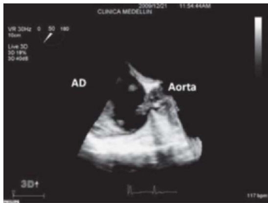
Figura 3. Aneurisma del seno de Valsalva no coronario con ruptura a aurícula derecha. Evaluación por ecocardiografía transesofágica 3D.