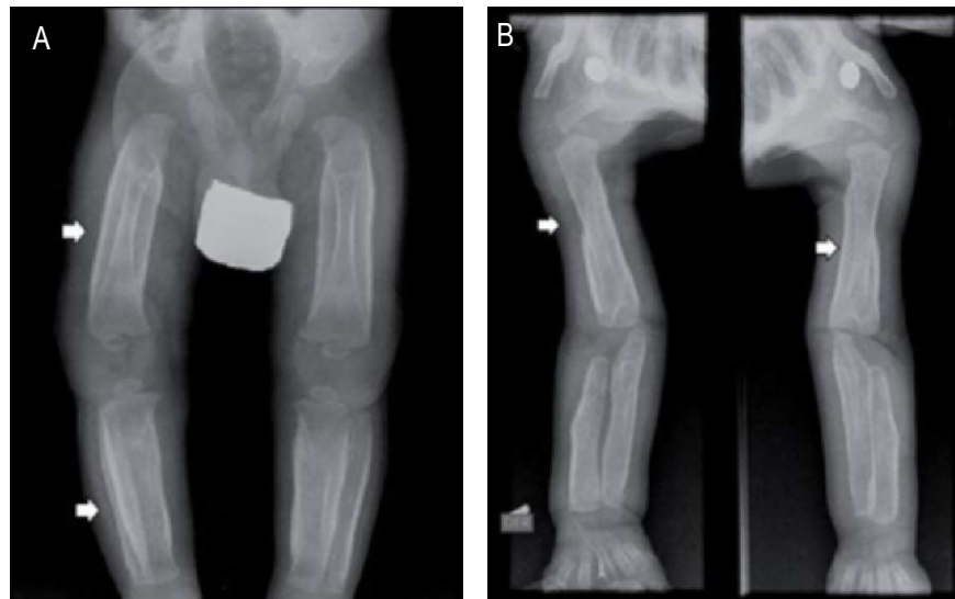
Figura 2. Radiografía de miembros inferiores (A). Radiografía de miembros superiores (B) de paciente de tres meses donde se observa importante hiperostosis reactiva de todas las corticales evaluadas (flechas blancas).

ingresó trasladado de institución de salud en el extranjero, con diagnósticos de atresia pulmonar más comunicación interventricular y ductus arterioso persistente con ramas pulmonares de 4 mm. Había sido tratado de forma intermitente con prostaglandina en infusión de 0,05 mcg/kg/min. Durante su hospitalización presentó sepsis por lo requirió antibioticoterapia. Ingresó a la unidad de cuidado intensivo cardiovascular donde fue estabilizado hemodinámicamente; luego fue trasladado a hemodinámica donde le rea-