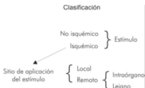
Figura 1. Clasificación del acondicionamiento según el tipo de estímulo y el sitio de aplicación.

De otra parte, están las ventanas de protección. Originalmente descrita, la respuesta inicial (ventana de protección) al estímulo de acondicionamiento es temprana (en minutos) y dura hasta dos a tres horas (4). Denominada clásica por algunos autores, es la respuesta más potente generada por la liberación de sustancias preformadas y modificación de proteínas existente. En 1993 se describió una segunda ventana de protección (tardía) con aparición a las 24 horas pero que dura hasta tres a cuatro días, y es generada por la modificación genética en la síntesis de diversas proteínas (21, 22).