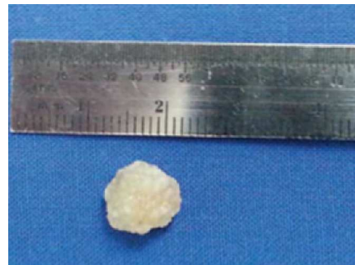
Figura 3. Masa macroscópica.