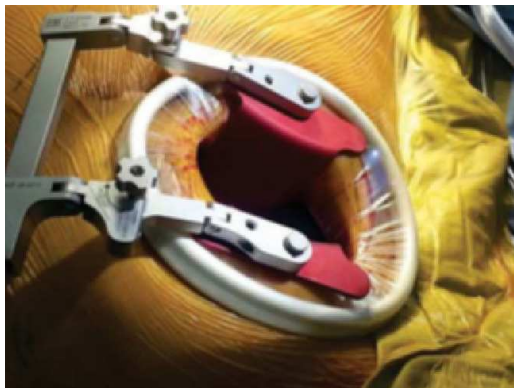
Figura 1. Minitoracotomía.

La mayoría de los pacientes cursan asintomáticos y el diagnóstico se realiza como hallazgo incidental. En algunas circunstancias la manifestación clínica es secundaria a embolización.