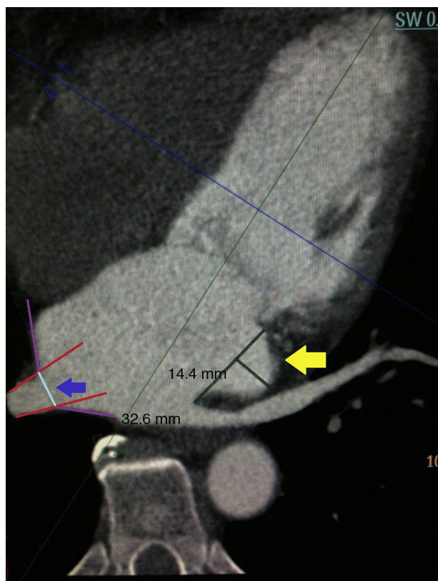
Figura 1 Flecha amarilla: medición del istmo mitral. Utilizando una reconstrucción ortogonal similar a la imagen de 4 cámaras cardíacas, se ubicó el istmo mitral localizado entre la inserción de la valva anterior de la válvula mitral y el ostium de la vena pulmonar inferior izquierda. La medición de la longitud se realizó trazando una línea recta entre ambos puntos. La profundidad del istmo se determinó trazando una línea perpendicular desde esa línea inicial hasta el borde de la aurícula y se consideró una evaginación del istmo mitral cuando esta superaba los 10 mm. En este caso, la longitud del istmo es de 32,6 mm y la profundidad de 14,4 mm. Flecha azul: determinación del ostium de la vena pulmonar. Se definió como ostium el punto de intersección entre la línea trazada por la pared de la aurícula (línea morada) y la línea trazada por la pared de la vena pulmonar (línea roja). El color de esta figura solo puede apreciarse en la versión electrónica del artículo.

el ostium de la vena pulmonar inferior izquierda. La medición de la longitud se realizó trazando una línea recta entre estos dos puntos (fig. 1). De acuerdo con lo que se ha descrito previamente, se consideró una evaginación del istmo mitral cuando la profundidad de este (medida como la distancia entre la línea antes descrita y el punto más profundo del istmo mitral) superaba los 10 mm 16 .