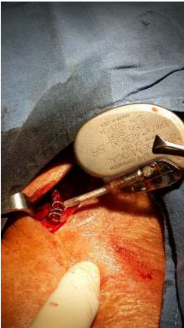
Figura 2 Extracción del generador. Se observa ruptura del electrodo y torsión significativa de la porción proximal del mismo, formando un tirabuzón.

una vara de pescar). Ambas producen dislocación de electrodos y en algunos casos daños de los mismos (reportados más comúnmente en el twiddler debido al tipo de torsión a la cual es sometido el electrodo). Menos frecuente es la rotación del marcapasos en el sentido contrario, empujando los electrodos de manera más profunda hacia las cavidades ventriculares 3 . Todos los dispositivos de estimulación cardíaca pueden presentar esta complicación, de hecho existen varios reportes de casos con resincronizadores y desfibriladores, incluso con dispositivos abdominales 4-7 . De manera llamativa, no todos los electrodos son traccionados de forma proporcional y es común que solo uno sea dislocado 7-9 . El twiddler es más común en mujeres, obesos, ancianos y en quienes se realiza un bolsillo excesivamente amplio; todas estas condiciones se asocian con mayor laxitud de los tejidos, lo cual permite el desplazamiento del marcapasos.