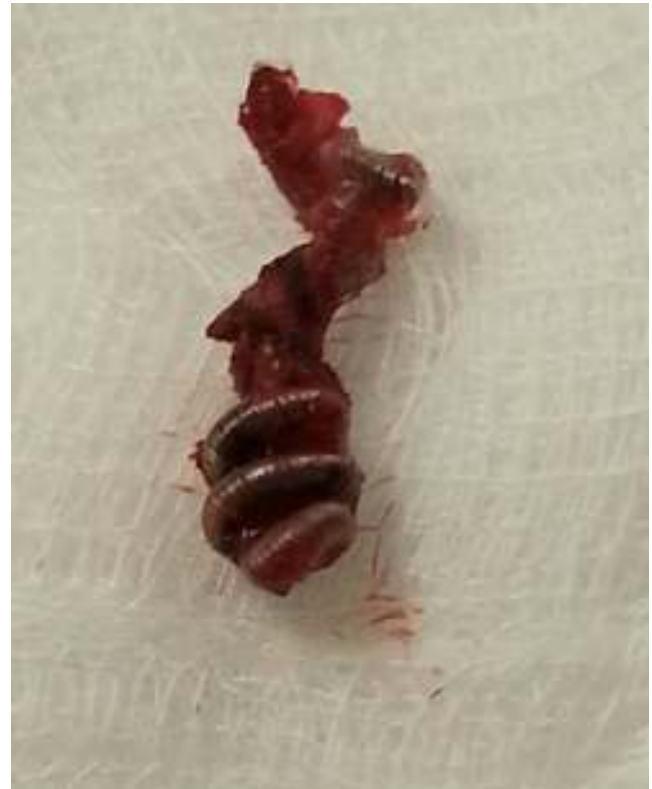
Figura 3 Detalle de la porción proximal del electrodo. La torsión marcada que generó el desplazamiento del dispositivo sobre el electrodo produjo ruptura total del electrodo con destrucción del lumen interno, lo cual impidió su extracción posterior.

Con base en información del equipo de trabajo, no hay caso alguno que reporte ruptura total del electrodo,