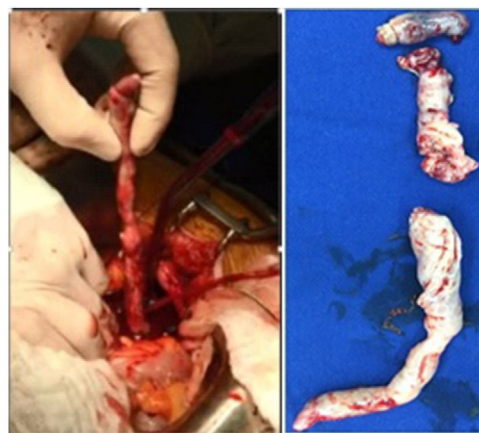
Figura 3 Pieza quirúrgica (fraccionada al momento de su escisión).

Dado el hallazgo incidental del caso presentado y el contexto de autoinmunidad, el diagnóstico inicial fue un trombo intracavitario que se extendía desde la vena cava inferior ante lo cual se inició anticoagulación terapéutica. En el estudio presentado por Li et al. el diagnóstico preoperatorio fue correcto en 54,3% de los casos mientras que en 30% fue erróneamente diagnosticado como mixoma y en 3,8% como trombo intracavitario. Hasta el momento no se documenta ninguna asociación entre lupus eritematoso sistémico y leiomatosis intravascular, de manera que este es el primer caso reportado en el que se presentan estas entidades de manera concomitante. A pesar de la histología benigna de la leiomatosis intravenosa, esta puede ser maligna en su modo de progresión pues la posibilidad de extensión vascular conlleva riesgo de muerte súbita 9,13,14 , así