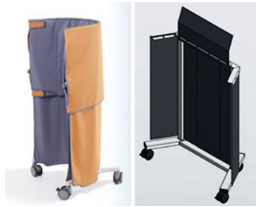
Figura 5 Protectores móviles plomados.

mesa y protege las extremidades inferiores y el área genital del profesional. Como el peso es soportado por la camilla se pueden usar valores mayores de atenuación equivalente de plomo (fig. 4).