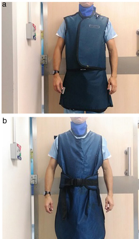
Figura 2 a) Kit chaleco-falda. b) Delantal.