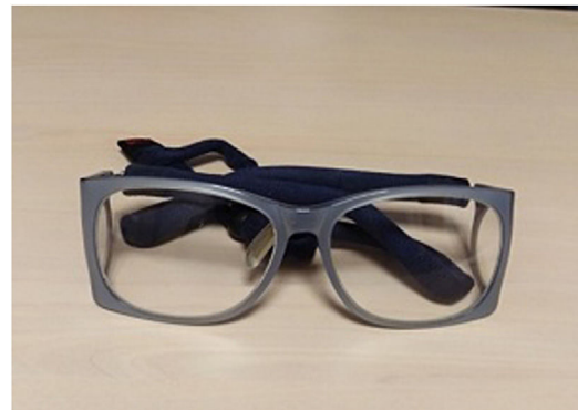
Figura 6 Gafas plomadas con protección lateral.