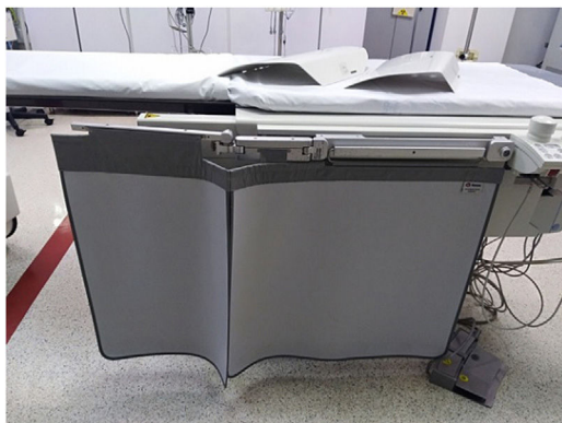
Figura 4 Cortinillas plomadas.

mesa y protege las extremidades inferiores y el área genital del profesional. Como el peso es soportado por la camilla se pueden usar valores mayores de atenuación equivalente de plomo (fig. 4).