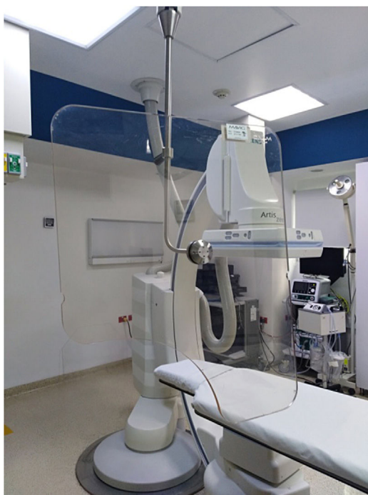
Figura 7 Mamparas de techo.