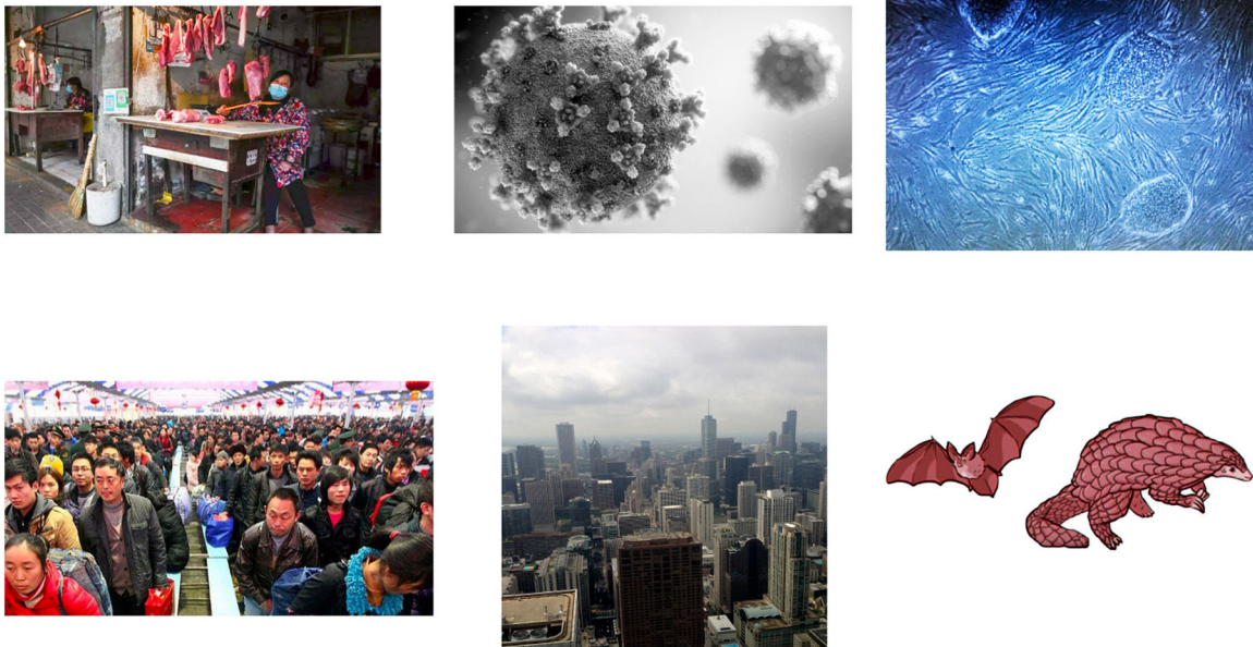
Figura 1 Representación gráfica de las diferentes circunstancias que pudieron dar origen a la infección por COVID-19. En un ambiente con alto contenido de partículas de contaminación, el virus pudo surgir desde un laboratorio, luego de muchos "pasajes" en diferentes líneas celulares, por contaminación zoonótica desde algunos mamíferos, como el pangolín o el murciélago, o luego de la transmisión entre humanos en sitios con alta conglomeración. En las grandes ciudades, el esparcimiento de las políticas públicas y debido a una equivocación al establecer las líneas primarias de defensa, es posible que incrementaran la transmisibilidad de la infección.

facilitaría la propagación. Bajo esta perspectiva, sea a través de turistas chinos, trabajadores textiles o por alguna otra ruta, el nuevo coronavirus desencadenó una epidemia a espaldas de la "primera línea de defensa" italiana que no fue reconocida durante las primeras semanas 11 .