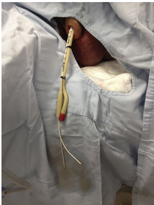
Figura 1 Catéteres rectos exteriorizados por uretra e introducidos a canal de drenaje de la sonda.

trayecto fistuloso e interposición de tejido nativo sano para prevenir recurrencias; en los casos en los que fallan todas las derivaciones también es factible hacer una embolización ureteral. Usualmente la reparación quirúrgica se debe hacer después de 6 meses, cuando el trayecto ha madurado y la inflamación local ha disminuido 1 .