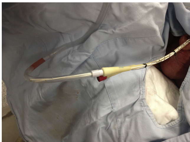
Figura 2 Sistema cerrado completo.

Todos nuestros pacientes tuvieron diferentes manejos para cáncer de próstata; está descrito que este tipo de pacientes pueden tener fístulas urinarias secundarias a los procedimientos a los que son sometidos. Aproximadamente un 0,3-3% de los pacientes sometidos a braquiterapia y un 0-0,6% de los llevados a radioterapia externa tienen como complicación una fístula urinaria 4-8 . Aunque estos porcentajes de complicaciones son bajos, la mitad de los pacientes a los que se les diagnostica un cáncer de próstata