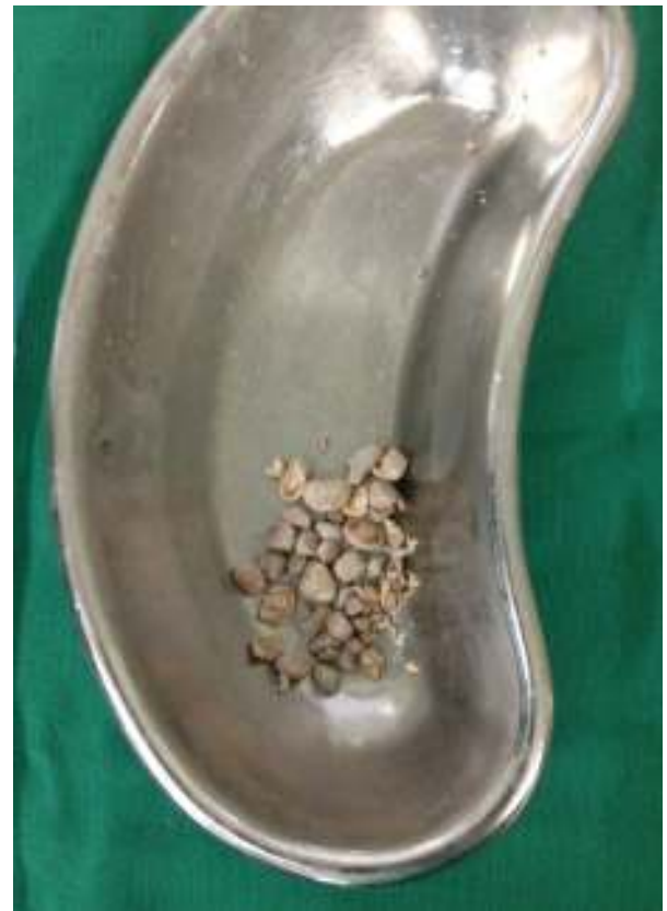
Figura 3 Litos extraídos.

Existen múltiples tratamientos descritos para el manejo de la cistolitiasis, como la cistolitotomía transuretral, la cirugía abierta y la cistolitotomía percutánea.