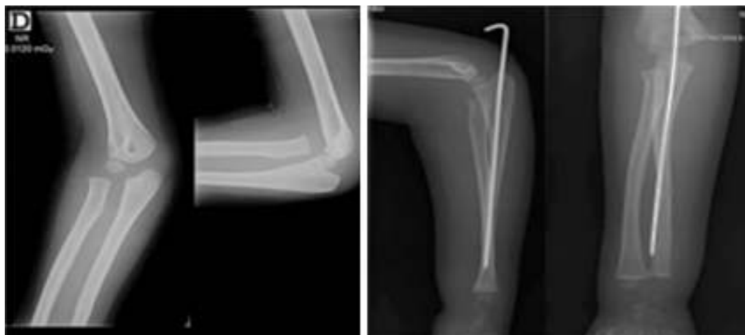
Figura 8 Radiografía de codo derecho preoperatoria y postoperatoria. Corresponde a una fractura-luxación de Monteggia de tipo I de Bado y a reducción de la fractura de cúbito y de la luxación radiocapitelar.