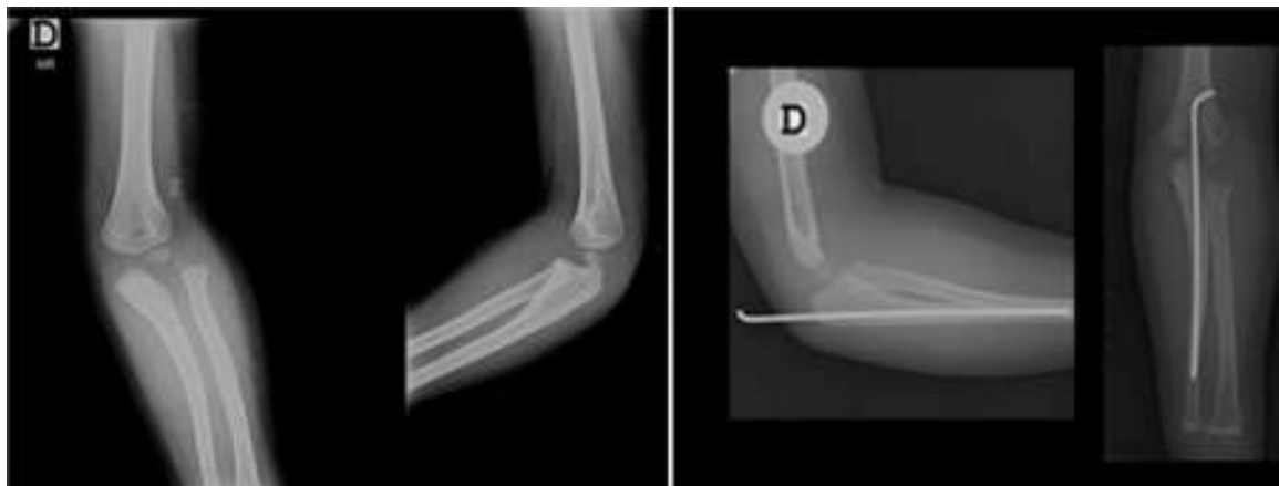
Figura 1 Radiografía de codo derecho preoperatoria y postoperatoria. Corresponde a una luxofractura de Monteggia de tipo III de Bado.

Paciente de sexo masculino de 6 años, quien fue atendido en el IOIR por presentar traumatismo en extensión del miembro superior izquierdo, con posterior edema, dolor y limitación funcional. En el examen físico se encontró edema