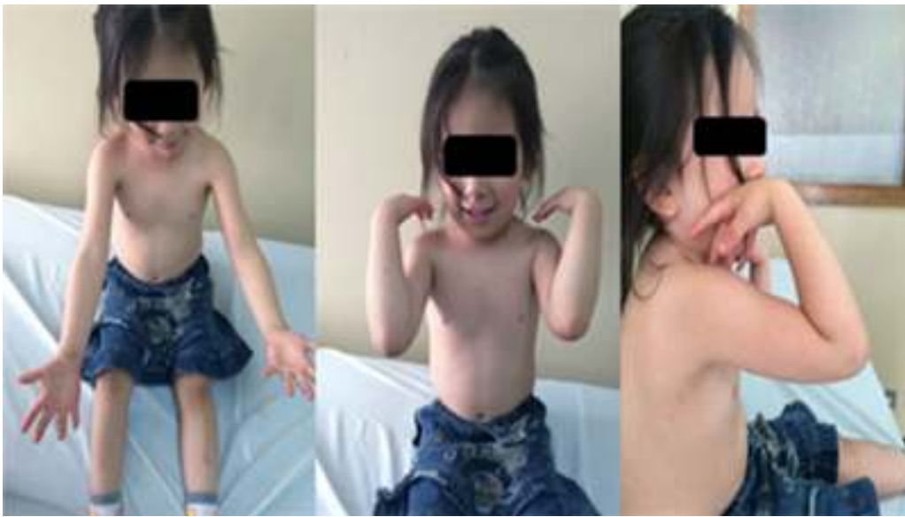
Figura 2 Arcos de movilidad a los 14 meses tras la cirugía.

del codo con hematoma sobre la cara lateral e imposibilidad para la flexoextensión del codo, así como imposibilidad para realizar extensión del pulgar. Se realizaron radiografías del codo, en las cuales se observó fractura en tallo verde del cúbito proximal y luxación lateral de la cúpula radial. Se realizó diagnóstico de luxofractura de Monteggia Bado tipo III (fig. 4). Es llevado el paciente a reducción cerrada de luxofractura de Monteggia y fijación percutánea del cúbito izquierdo. Posteriormente se verificó la estabilidad y reducción de la lesión (fig. 4). Se realizó retiro del clavo de Steinmann luego de ocho semanas y durante los controles posteriores se evidenció recuperación completa de la lesión neurológica. En el seguimiento a 6 meses se encontraron arcos de movilidad del codo en flexión de 110^\circ , extensión de 0^\circ , supinación completa y pronación de 40^\circ (fig. 5). Durante los controles radiográficos se observó fractura consolidada y reducción de la luxación de la cúpula radial izquierda (fig. 6).