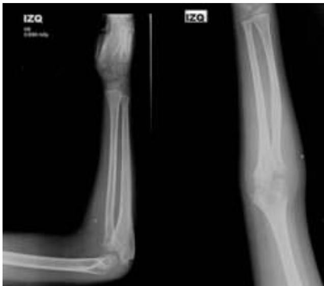
Figura 6 Radiografía de codo AP y lateral a los 6 meses tras la cirugía.

Paciente de sexo femenino de 3 años, con traumatismo contundente sobre el codo y brazo derecho, con posterior edema, dolor y limitación funcional. En el examen físico se encontró imposibilidad para realizar arcos de movilidad del codo con un examen neurológico normal. Se tomaron radiografías de codos comparativos donde se observa luxofractura de Monteggia de tipo I de Bado (fig. 8). Se realizó una reducción cerrada de la luxofractura de Monteggia y fijación percutánea del cúbito derecho con un clavo de Steinmann y se verificó una adecuada reducción y estabilidad de la luxofractura mediante visión fluoroscópica y con radiografías (fig. 8). Se realizaron controles posquirúrgicos durante 4 meses en los cuales presentó ganancia de arcos de movilidad hasta su normalidad y controles radiográficos donde se observó consolidación de la fractura del cúbito y reducción de la luxación de la cúpula radial derecha (fig. 9).