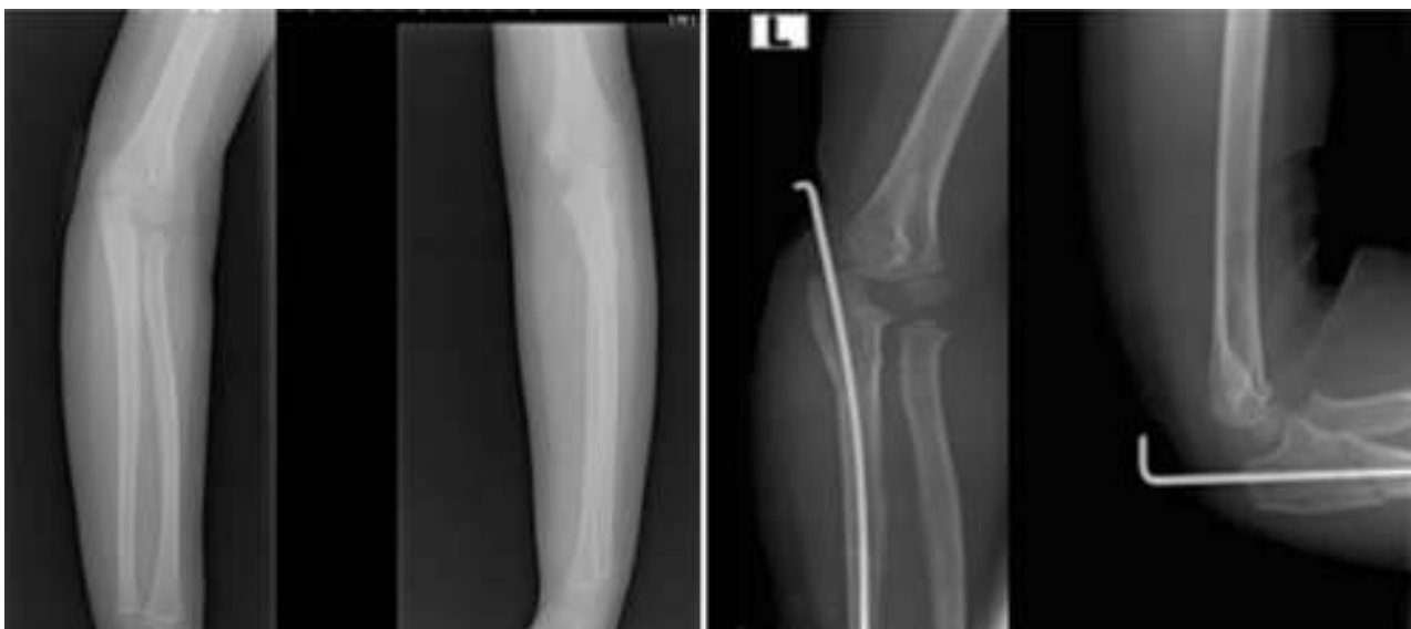
Figura 7 Radiografía de codo izquierdo preoperatoria y postoperatoria. Corresponde a una fractura-luxación de Monteggia de tipo III de Bado y a reducción de la fractura de cúbito y de la luxación radiocapitelar.