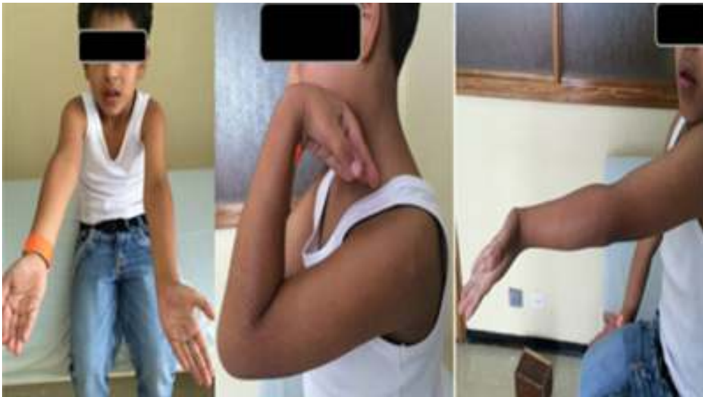
Figura 5 Arcos de movilidad a los 14 meses tras la cirugía.