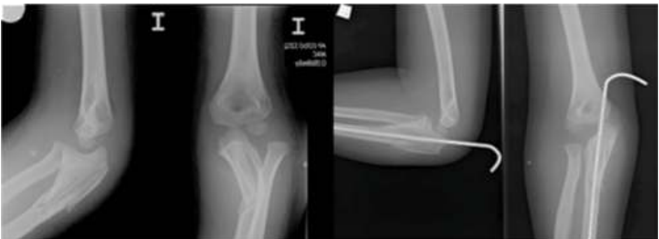
Figura 4 Radiografía de codo izquierdo preoperatoria y postoperatoria. Corresponde a una fractura-luxación de Monteggia de tipo III de Bado. Se observa reducción de la fractura del cúbito y de la luxación radiocapitelar.