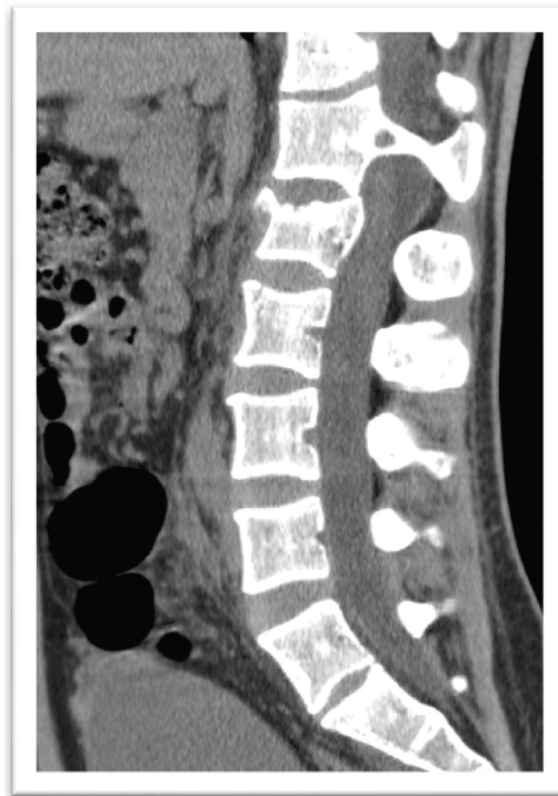
Figura 1 Tomografía computarizada en proyección sagital que muestra diastematomielia de la segunda vértebra lumbar (tipo 1).

Paciente masculino de 24 años acude al servicio de urgencias por cuadro de 24 horas de evolución, caracterizado