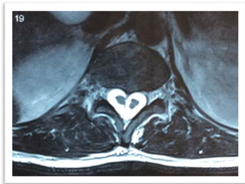
Figura 3 Resonancia magnética que muestra distematomielia en L1 de tipo 1.

tipo I. También se observó fractura A3 en L2 sin invasión a canal medular.