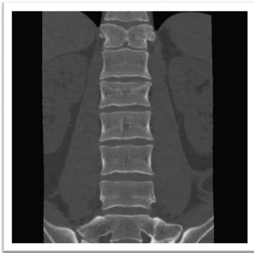
Figura 2 Tomografía computarizada coronal lumbosacra que muestra hemivértebra en T12 con diastematomielia de tipo I y fractura A3 de la segunda vértebra lumbar.