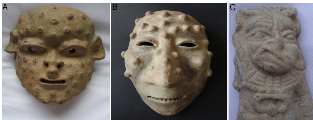
Figura 19 – Máscaras de cerámica de la cultura ecuatoriana Jama-Coaque (A) y del altiplano nariñense (B) con erupción del rostro compatible con verruga peruana a bartonelosis. C: estatuilla Tumaco-La Tolita que representa una parálisis facial periférica.

Las máscaras precolombinas fueron de oro, cobre, tum-baga, plata, jade, piedra, cerámica, concha y madera; buscaban resaltar ciertos elementos del rostro de quien en vida o muerte las portara y cuyo significado particular con seguridad estuvo