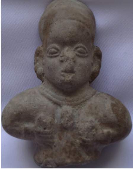
Figura 4 – Mujer con cabello recogido de la cultura Tumaco-La Tolita.

que ya desde esos tiempos asociaran la forma del abdomen de la gestante con el sexo del feto, al igual que se dice en el refrán popular: si la embarazada tiene el abdomen curvo y aplanado tendrá una niña, si es puntudo, será niño.