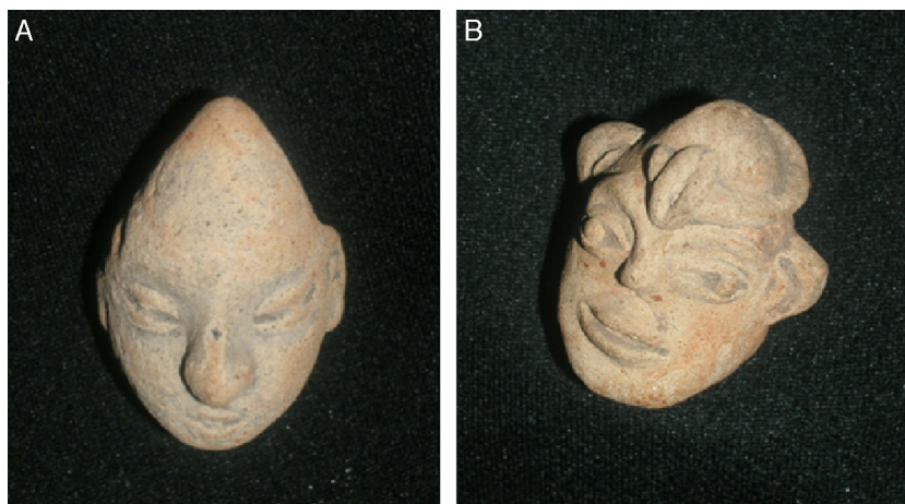
Figura 17 - Cultura Tumaco-La Tolita con deformación del cráneo de forma cónica, parecido a las pirámides.

tener una mejor comunicación telúrica cósmica. En B se ven características de un cuadro dismorfológico tipo síndrome de Crozon: orejas antevertidas, puente nasal alto, ojos prominentes, filtro nasal largo y mentón robusto.