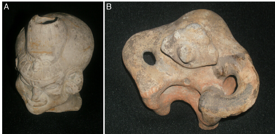
Figura 16 - A: personaje Tumaco-La Tolita con un tocado tipo cara de pájaro en un rostro asimétrico. B: mujer con gran giba, señal de acumulación de conocimientos.

desde el nacimiento. Es menos frecuente que otras deformaciones craneanas practicadas. Con seguridad esta forma cónica buscaba parecerse a las pirámides, lugares de culto, y que sus elegidos portadores con linaje chamánico pudieran