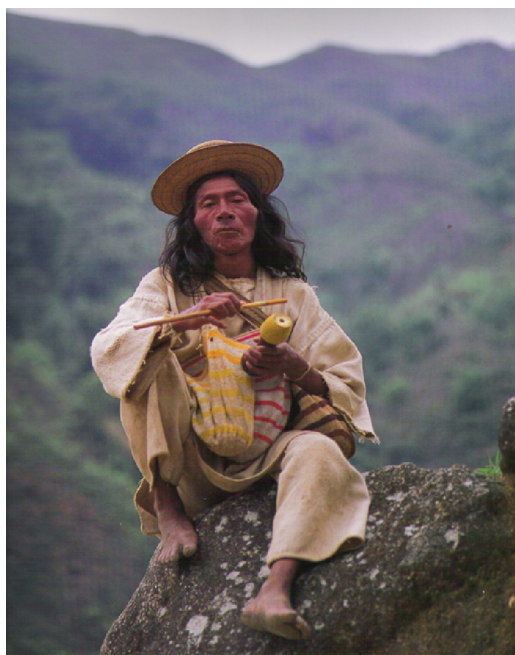
Figura 12 – Indígena kogui con su poporo para mambear hayu.

La figura 13, de Tumaco-La Tolita, refleja ritos de paso en esa cultura. La primera (A), un medallón con 2 orificios para pasar los hilos o cuerdas que lo hacían pender del cuello, muestra