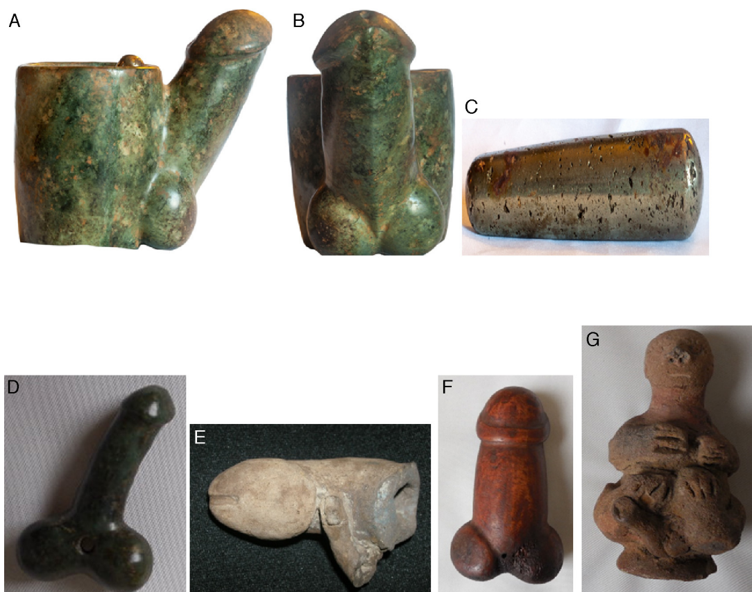
Figura 20 – Todas representan falos, excepto C, que corresponde al pistilo o mano del mortero observado en A y B.

atado al valor de peculiaridad que daba uno de sus elementos, que como en el caso de estos 3 rostros señala lo que hoy denominamos enfermedades.