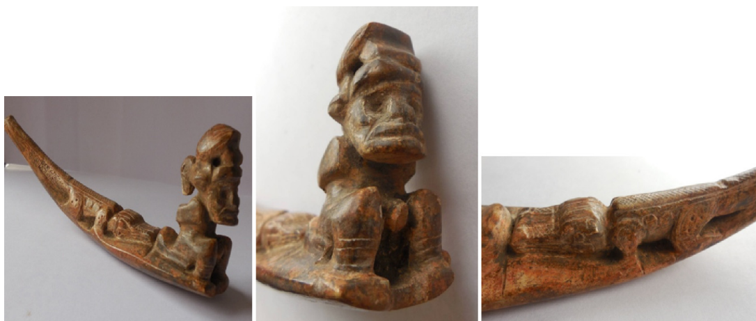
Figura 22 – Talla en hueso de la región Tayrona con un hombre sentado, los brazos atrás, falo erecto y cuencas de los ojos vacíos. Hay un pájaro en la cabeza y un caimán con la jeta cerrada.