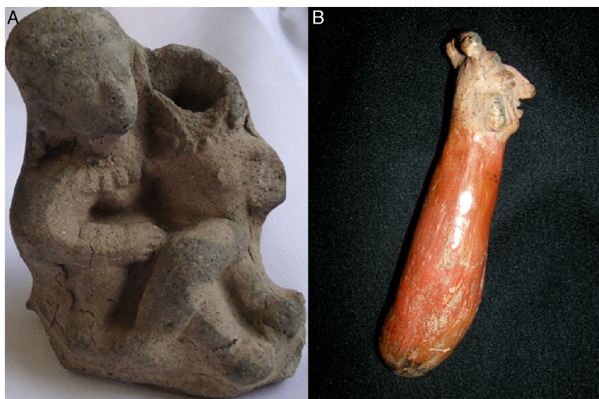
Figura 11 – A: mujer de la cultura Tumaco-La Tolita sin cabeza por fractura de la cerámica, sentada en los muslos de otra que tiene su mano derecha en los genitales de la primera. B: objeto Capulí de forma fálica con la cabeza de un hombre en un extremo.

el hayu dentro de su boca. Los indígenas de las 4 comunidades de la Sierra Nevada de Santa Marta, koguis, arhuacos, wiwas y kankuamos, portan el poporo de calabazo, expresión de la vagina y el útero, con su mano izquierda, y el palito, expresión del pene, que introducen en el poporo para extraer la cal, con la mano derecha (fig. 12). De nuevo se resalta la asociación de lo femenino con lo izquierdo y lo masculino con lo derecho.