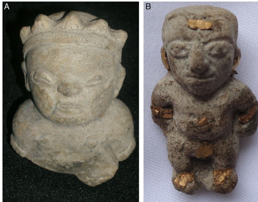
Figura 18 – Dos enanos de la cultura Tumaco-La Tolita. A: corresponde a una acondroplasia. B: con 9 placas de oro en diferentes partes del cuerpo.

Las imágenes de la figura 18 , de la cultura Tumaco-La Tolita, muestran casos de enanismo. En A, con acortamiento de los miembros superiores y macrocefalia con una corona de 5 puntas, señal de su poder; en B, con acortamiento de los miembros superiores sin macrocefalia, pero con 9 pequeñas placas de oro adheridas a la frente, las orejas, el abdomen, los brazos, la zona genital y los pies, en señal del poder del personaje. La primera cerámica corresponde a un cuadro de acondroplasia. Los enanos fueron seres asociados con el cuidado de las fuentes naturales de la vida, los bosques, las cachiveras o raudales o saltos, etc., y así mantener ciertas tradiciones de gran valor para las sociedades indígenas, como los textos escritos entre los mayas de Mesoamérica.