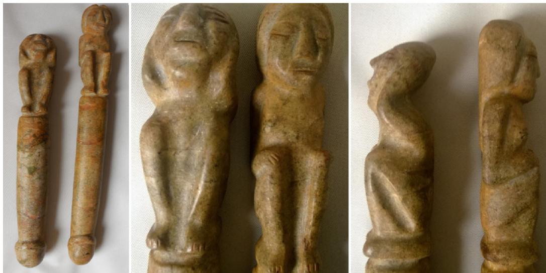
Figura 21 – Diferentes tomas de 2 desvirgadores en mármol, pertenecientes a la cultura del altiplano nariñense.

masculino con la sangre femenina emanada de la vagina, ya que se suponía que tenía poderes maléficis y podía ocasionar debilidad y enfermedad.