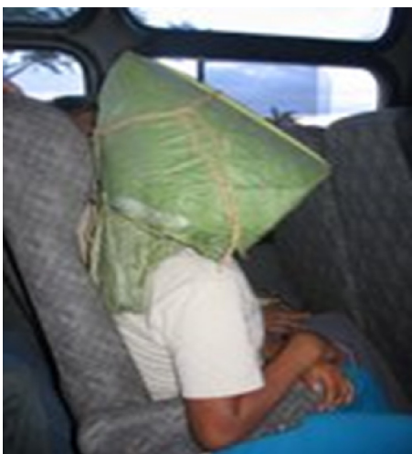
Figura 14 – Niña u'wa con la cócora. Resguardo indígena Chaparral Barro Negro, departamento de Casanare, Colombia.

Las imágenes de la figura 17, pertenecientes a la cultura Tumaco-La Tolita, presentan en común una deformación cultural del cráneo de forma cónica, que comienza a moldearse