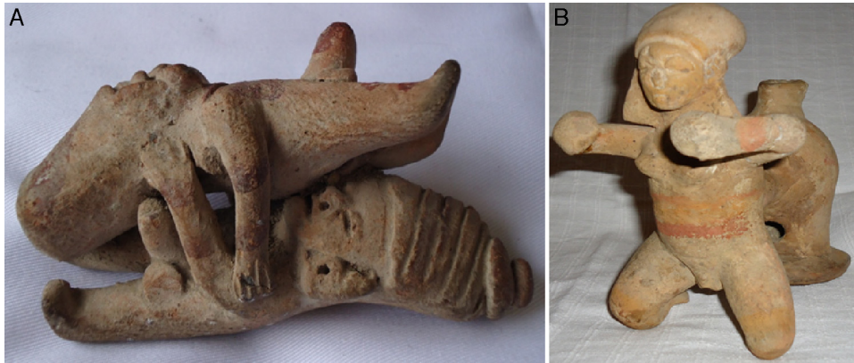
Figura 15 - A: de la cultura ecuatoriana Guangala, muestra una relación homosexual con la práctica del annilingus , donde ambos tienen sus penes erectos. B: personaje adulto de Tumaco-La Tolita con senos y genitales femeninos, probablemente un síndrome de Klinefelter.