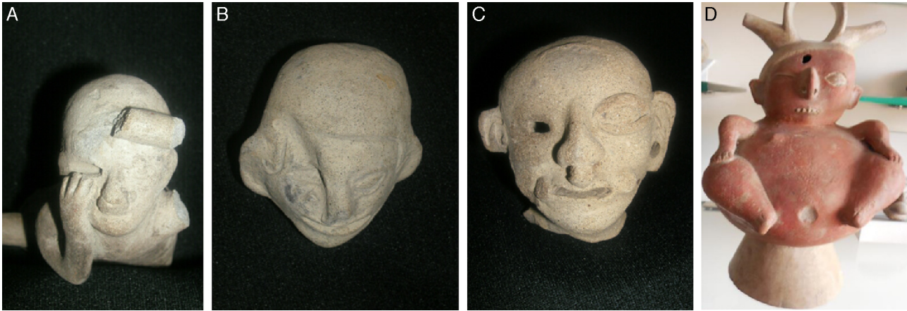
Figura 9 – Pertenecientes a la cultura Tumaco-La Tolita. Se aprecia la pérdida del ojo derecho. En la cerámica D de la cultura Malagana el ojo derecho lo tapan los párpados.

amputación del antebrazo derecho de un hombre sentado en un butaco que mastica o mambea hayu. La segunda (B), de la cultura Sinú de la costa Caribe colombiana, 200 a. C.-1500 d. C., corresponde a un hombre sin manos. Con seguridad no se trata de la ausencia congénita del antebrazo y las manos porque se sabe que ese tipo de defectos de nacimiento motivaba y motiva el infanticidio temprano de las criaturas de las culturas indígenas.