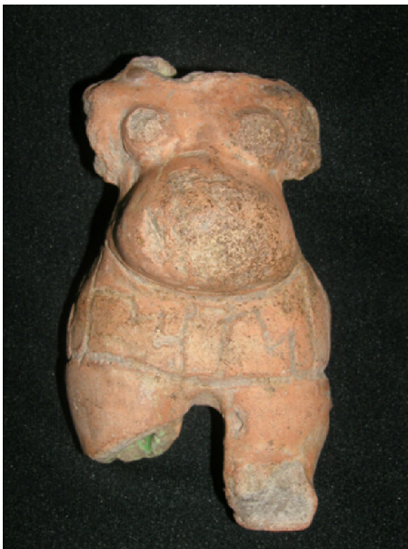
Figura 5 – Tronco, caderas y muslos de una mujer con faldilla, cultura Tumaco-La Tolita.

Obsérvese la vasija con doble vertedera en la que una mujer lacta con su seno izquierdo a su pequeño hijo, de la cultura Ylama del suroccidente colombiano, 700 a. C.-0 (fig. 6). La figura 7, perteneciente a la cultura Tumaco-La Tolita, muestra también a una mujer que lacta a su hijo con el seno izquierdo. Sobre la base de que el 90% de las personas tienen su lado derecho como el dominante, por lo mismo como el más fuerte, y que se sabe que los hombres tienen más fortaleza que las mujeres, muchas sociedades de diferentes lugares del mundo