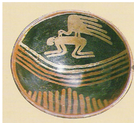
Figura 3 – Plato de la cultura Piartal.

La figura 5, también perteneciente a la cultura Tumaco-La Tolita, corresponde al tronco, las caderas y los muslos de una mujer con una faldilla que muestra una gran masa abdominal, probablemente. A pesar de la altura, debe corresponder a un embarazo. Mantiene el famoso coeficiente de 0,7-0,75 tras dividir el perímetro de la cintura por el de la cadera. Es posible