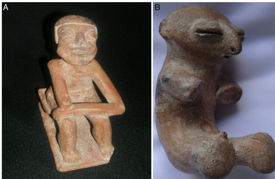
Figura 10 – A: cerámica del altiplano nariñense colombiano de la cultura Capulí, con amputación del antebrazo derecho. B: cerámica de la cultura Sinú, sin manos ni antebrazos.