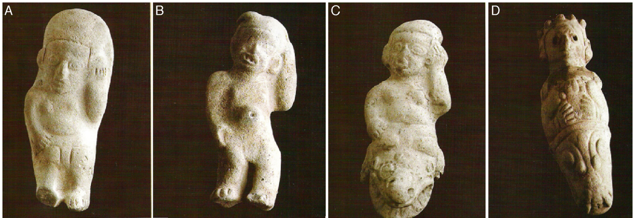
Figura 8 – Los 3 primeros personajes (A-C) se llevan la mano izquierda a la oreja, expresando la secuencia de dolor, enfermedad y proximidad al fallecimiento. El cuarto (D) expresa la muerte.

contra los enemigos, mientras son vírgenes [...]. Carecen del seno derecho, pues, cuando son niñas, aún de corta edad, sus madres les aplican al seno derecho un aparato de bronce, construido con tal finalidad, tras haberlo puesto al rojo; el pecho se quema, de suerte que se anula su desarrollo y transmite todo su vigor y plenitud al hombro y brazo derechos». En los Aforismos de los Tratados hipocráticos se consigna que: «Si a una mujer embarazada, que tiene en su vientre gemelos, le adelgaza un pecho, aquélla pierde uno de los 2 fetos. Si se le seca el pecho derecho, el varón; si se le seca el izquierdo, la hembra»; «El embrión masculino está en la parte derecha, el femenino más bien en la izquierda» y «Si una mujer lleva en su vientre un varón, tiene buen color; si lleva una hembra, mal color».