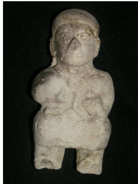
Figura 7 – Mujer que lacta a su hijo con el seno izquierdo, de la cultura Tumaco-La Tolita.

El lado derecho es masculino en muchas sociedades, como fue para la Grecia Clásica. La leyenda griega de las amazonas consignada en Sobre los aires, aguas y lugares de los Tratados hipocráticos cuenta que «Por otra parte, en Europa habita el pueblo de los escitas[...]. Sus mujeres montan a caballo, disparan con el arco, arrojan dardos desde los caballos y luchan