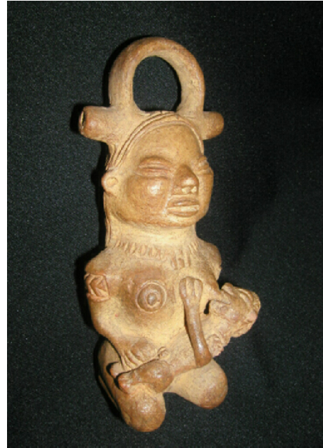
Figura 6 – Vasija con doble vertedera de la cultura Ylama. Mujer que lacta a su hijo con el seno izquierdo.

han asociado el lado derecho con lo masculino y el izquierdo con lo femenino. Lactar con el seno izquierdo significaría darle al niño la parte más femenina. Se sabe que, en general, el arte universal muestra en un 85% a la mujer lactando con el seno izquierdo.