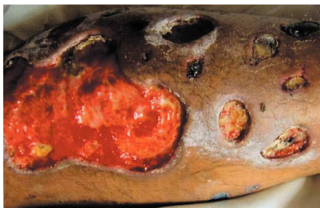
Figura 2. Acercamiento de las lesiones ulcerosas.