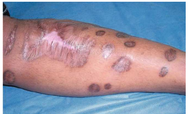
Figura 5. Cicatrización completa de las úlceras luego del inicio de la anticoagulación.

contrastando con la polineuropatía informada en la literatura; no se cumplen criterios de SAF catastrófico, las anticardiolipinas fueron negativas; el criterio paraclínico que confirmó el diagnóstico en nuestro caso fue la presencia de anticoagulante lúpico y los anticuerpos anti-B2 glicoproteína 1 y no se presentó respuesta a inmunosupresión.