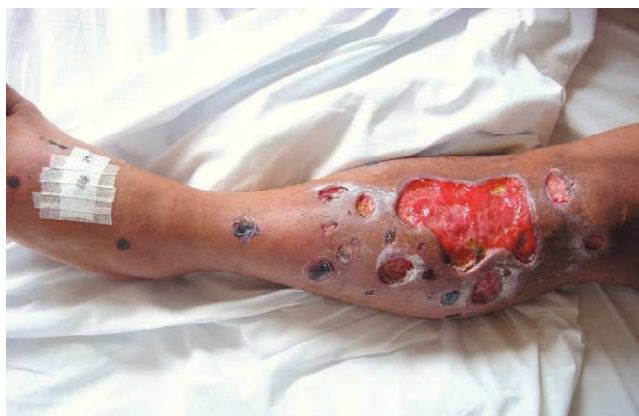
Figura 1. Presencia de múltiples úlceras en sacabocado en región pretibial y dorsal del pie izquierdo, con presencia de pie caído.

Hombre de 34 años, quien consulta por presentar cuadro clínico de dos meses de evolución consistente en aparición de máculas violáceas que evolucionaron a placas necróticas en región pretibial y dorso del pie izquierdo, de rápido crecimiento, convirtiéndose en úlceras en sacabocado, muy dolorosas. En el hospital local se realizó tratamiento con desbridamiento y varios regímenes de antibioticoterapia con ampicilina/sulbactam, gentamicina, penicilina, trimetoprim sulfametoxazol y ceftriaxona, sin mejoría. A la revisión por sistemas se encuentra pérdida de peso no cuantificada e hipoestesia inferior izquierda que evolucionó a pie caído (Figuras 1 y 2).