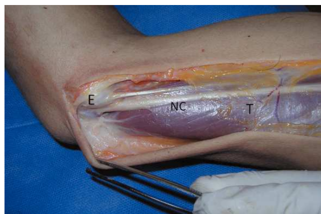
Figura 3. Se aprecia el nervio cubital (NC), llegando posterior al epicóndilo medial y pasando a través del arco fibroso formado entre las cabeza del origen del FCU. E: epicóndilo medial; T: tríceps