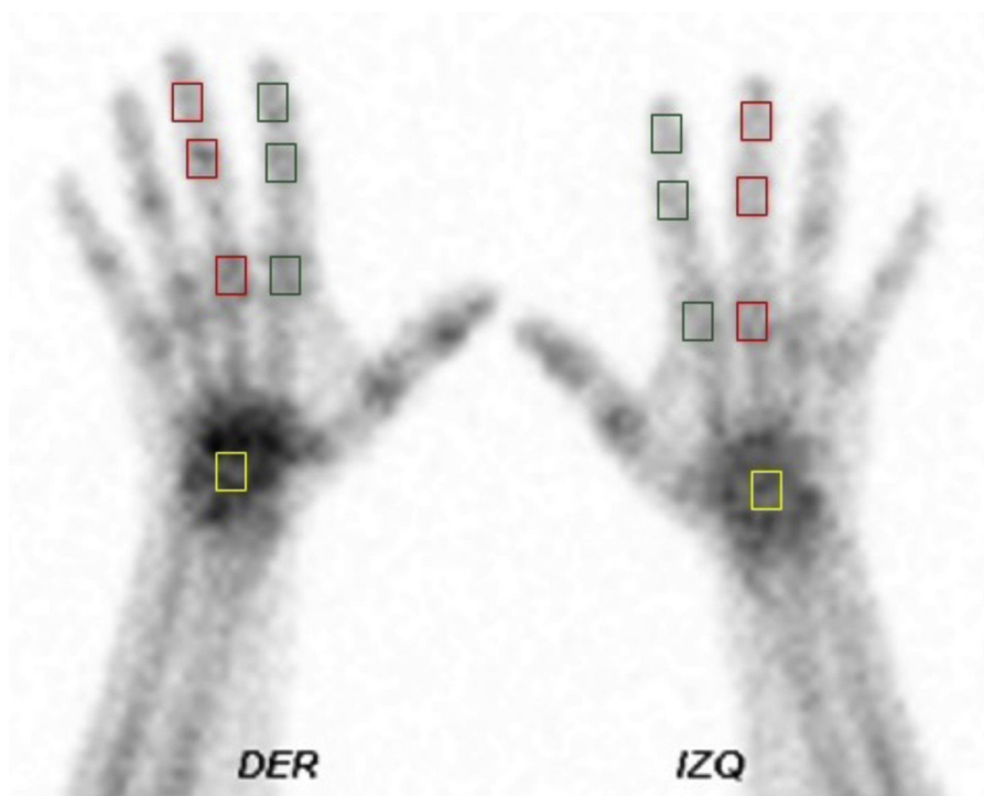
Figura 1 – Áreas de interés. Gammagrafía ósea de manos; en cuadros verdes, áreas de interés sobre las articulaciones interfalángicas y metacarpofalángica del segundo dedo; en cuadros rojos, áreas de interés sobre las articulaciones interfalángicas y metacarpofalángica del tercer dedo; en cuadros amarillos, áreas de interés sobre el carpo.

Los datos fueron analizados de acuerdo con el género y la edad, para lo cual la población fue agrupada de la siguiente manera: 18-25, 26-35, 36-45, 46-55, 56-65 y mayores de 65 años.