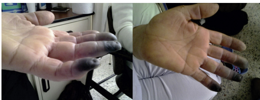
Figura 2 – Lesiones isquémicas de las falanges distales del tercer, cuarto y quinto dedos de la mano izquierda.

realiza angiotomografía de tórax, con la que se diagnostica tromboembolismo pulmonar de arteria interlobar derecha. Se considera que se trata de un síndrome hipercoagulable, por lo que se inicia anticoagulación. Estudios reportan ANA negativos, ENA negativos, perfil de antifosfolípidos negativo. Se hace tamización de neoplasia oculta descartando masas a nivel del tórax, el abdomen, las mamas y ginecológico. La paciente queda anticoagulada por sus múltiples eventos trombóticos, lo que limita la totalidad de estudios de hipercoagulabilidad. Se completa el estudio con crioglobulinas, crioaglutininas y electroforesis de proteínas, los cuales son normales. Finalmente no se logra recuperar la perfusión de las falanges y requiere de amputación y posterior egreso con anticoagulación por tiempo indefinido.