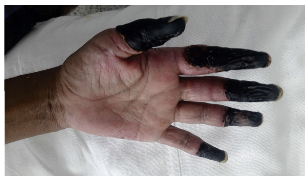
Figura 3 – Lesiones isquémico-necróticas en zona distal de los 4 artejos de la mano izquierda en paciente con síndrome cocaína/levamisol.

Paciente varón con consumo frecuente de cocaína, que ingresa por dolor y cambios en la coloración de la zona distal de los 5 dedos de la mano izquierda (fig. 3). Se realiza electrocardiograma de 24 horas (Holter) y ecocardiograma que descarta origen cardioembólico. Debido a episodios similares, pero no tan graves, se había solicitado electroforesis de proteínas, las cuales no tienen alteraciones. Se solicitan ANA, ANCA, que previamente eran positivos, y en esta ocasión eran igualmente positivos pero con títulos bajos, además con complemento