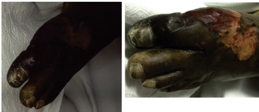
Figura 1 – Paciente con lesiones isquémico-necróticas en fase aguda, con predominio en el primer artejo y el dorso del pie, con área de desfacelación circundante.