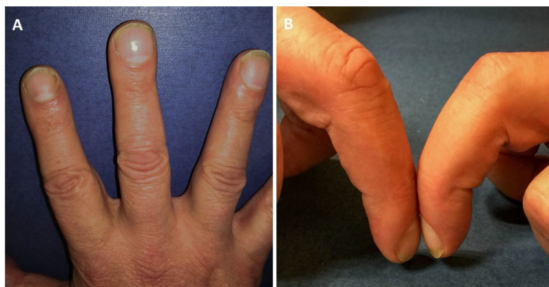
Figura 1 – A. Aumento de volumen de la falange distal. B. Pérdida de la ventana ungueal (signo de Schamroth).