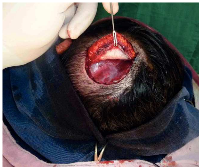
Figura 2 Resección del tumor con margen lateral de tejido sano de 1,5 centímetros, incluyendo en profundidad la fascia temporal superficial.

Existe una propuesta para agrupar los tumores pilares proliferantes en tres grupos, correlacionando los hallazgos histológicos con el potencial de malignidad. El primer grupo