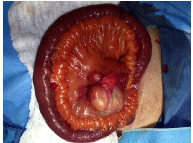
Figura 2 Hallazgo quirúrgico del quiste en el mesenterio del íleon.

Las MCN son tumores quísticos uni o multiloculados con una cápsula fibrosa y tapizados por un epitelio productor de mucina, asociado a un estroma subepitelial, que inicialmente fue descrito como similar al ovario (OLS por su sigla en inglés Ovarian Like Stroma) y que es común en las MCN del páncreas y riñón, pero que no siempre está presente en las MCN mesentéricas y que no es requisito para el diagnóstico (2).