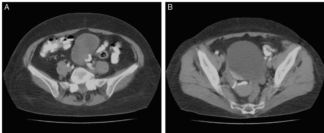
Figura 1 A. Imagen tomográfica de la masa quística parcialmente calcificada. B. Corte inferior que muestra la vejiga y los anexos sin relación con el quiste.

de neoplasia mucinosa quística en el mesenterio del íleon distal de una mujer adulta. Esta lesión fue erróneamente interpretada en las imágenes, como un quiste ovárico complejo. Es el caso número 18 reportado en la literatura, hasta donde conocemos.