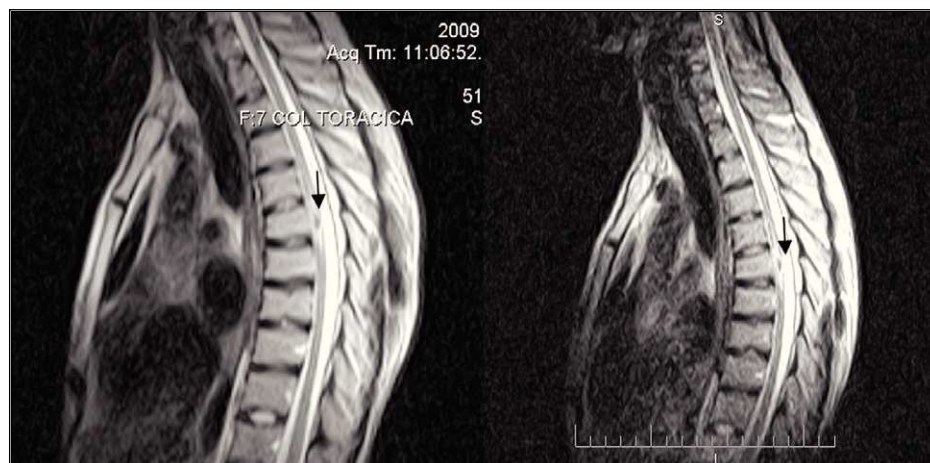
Figura 3. Imágenes por resonancia magnética de la columna torácica en proyección sagital en T2, que evidencian lesión intramedular hipointensa a la altura de T7, con área de edema perilesional que genera un aspecto de "lesión en anillo", sin compromiso vertebral, paravertebral o del disco

En pacientes con tuberculosis espinal, los corticosteroides disminuyen los síntomas neurológicos e, incluso, permiten prevenir su inicio. En nuestro caso, los síntomas desaparecieron totalmente en el periodo inicial (2). Aunque no hay estudios sobre su uso en tuberculosis intramedular, se recomiendan los corticosteroides en aquellos pacientes que no mejoran con quimioterapia, que se deterioran al iniciar el tratamiento tetraconjugado o que manifiestan síntomas compresivos. En estos casos, las dosis