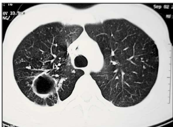
Figura 2. Tomografía axial de tórax, con contraste, en ventana para parénquima, en la que se observan micronódulos centrolobulillares en el pulmón derecho; quiste de 2 x 3 cm de pared gruesa en el segmento apical y el posterior del lóbulo superior derecho, con nivel hidroaéreo en su interior; e imágenes lineales pleuropulmonares indicativas de fibrosis.

(8 %) (5) ; por otra parte, según el segmento medular comprometido, se puede clasificar en cervical, dorsal o lumbar; la más común es la dorsal (1,2) .