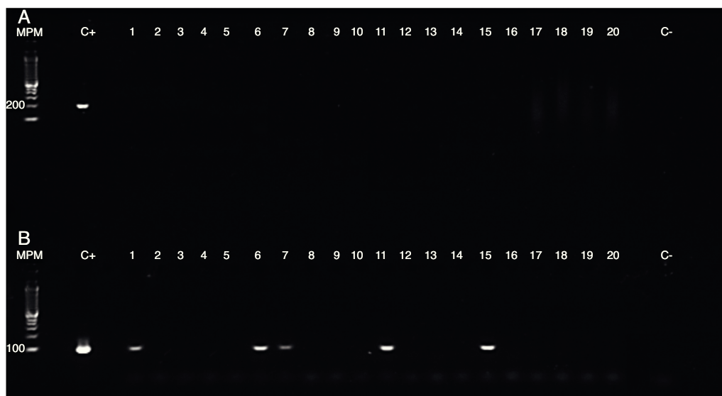
Figura 1 Electroforesis en gel de agarosa al 2%.

El análisis de proporciones, con un 95% de confianza, para los tipos de carne, mostró que en Sincelajo se puede consumir carne infectada de pollo en porcentajes que van de 21,1 a 51,7%, carne de cerdo en porcentajes que van de 19 a 49,2% y carne de res en porcentajes que van de 13,2 a 41,5%.