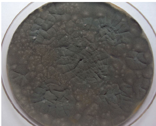
Figura 1 Cultivo de aspirado traqueal en el que se aisló Aspergillus fumigatus . Agar sabouraud. Descripción: colonias verde oscuro, planas, plegadas, ilimitadas, aterciopeladas.

descartó sinusitis. Se tomó aspirado traqueal ante la sospecha de neumonía asociada a la ventilación mecánica, que documentó la presencia de Aspergillus fumigatus (fig. 1). La TAC de alta resolución de tórax reportó atelectasia basal izquierda, derrame pleural bilateral, engrosamiento liso de los septos con signos de hipertensión pulmonar y sin evidencia de signo de halo ni de semiluna (fig. 2). Es valorado por el servicio de Neumología quien realizó una fibrobroncoscopia con LBA, evidenciando la presencia de una úlcera en carina, que era la causa de la hemoptisis; se tomó biopsia de esta úlcera que reportó la presencia de esporas e hifas septadas, ramificadas en ángulo agudo, compatibles con