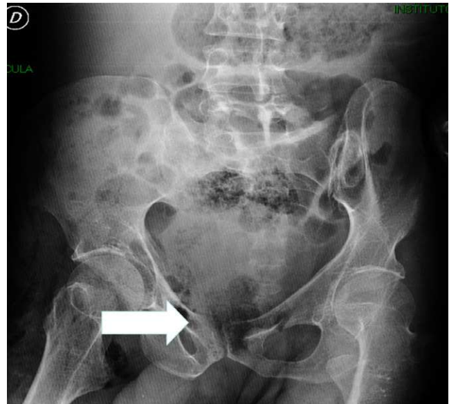
Figura 1 Radiografía de pelvis, la flecha muestra gas por fuera de la ampolla rectal y en tejidos blandos de muslo.

Al examen físico de ingreso se encontró paciente en muy regular estado general, alerta y orientado en las tres esferas. Los signos vitales mostraron FC: 104 × min, FR: 24 × min TA 100/60, T: 38,3 °C, ECOG de 2/0 y Karnovsky de 40/100. El examen cardiopulmonar sin sobreagregados auscultatorios. El abdomen se encuentra doloroso a la palpación de manera difusa pero sin signos de irritación peritoneal. Al examen de las extremidades se observan secuelas de la poliomielitis por deformidad en flexión del miembro inferior izquierdo y atrofia muscular generalizada. En el miembro inferior derecho la piel lucía íntegra, del mismo color del resto del cuerpo, con aumento considerable del volumen del muslo y se palpaban