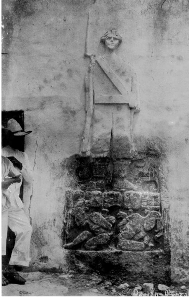
FIGURA 1. Estela 1 de Dzilam González cuando estaba empotrada a un muro del palacio municipal y se plasmó encima la figura de un soldado con bayoneta. Novelo, 2004: 121.