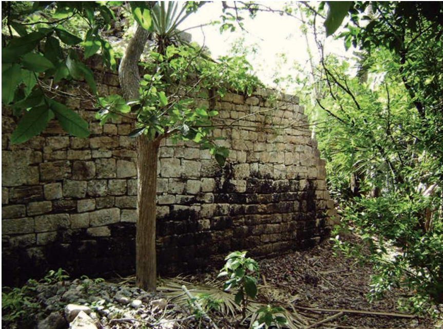
FIGURA 3. Muro poniente del cuerpo inferior de la estructura 1.

tor sureste tiene una longitud de 33 m y una altura máxima de 2.92 m, con 17 hiladas superpuestas visibles (figura 3). Parte de este mismo cuerpo también es visible en la sección noroeste, pero en esta parte forma una esquina con ángulo de 90 grados y presenta una moldura media a partir de la cual sobresale un paramento superior, que por desgracia colapsó en fechas relativamente recientes, ya que una fotografía tomada por Edward Kurjack en la década de 1970 muestra estos muros en pie (figura 4).