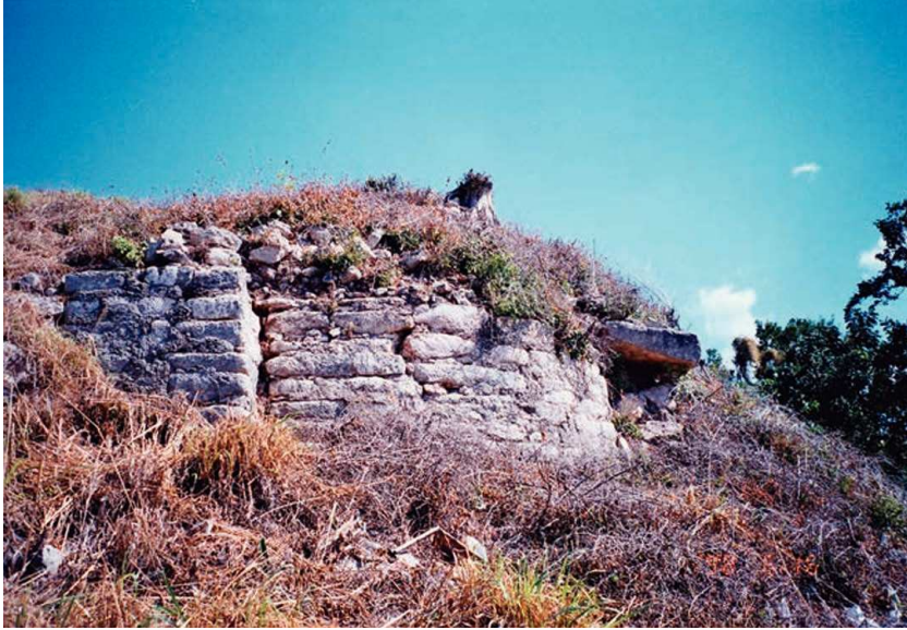
FIGURA 5. Esquina suroeste del cuerpo superior de la estructura 2.