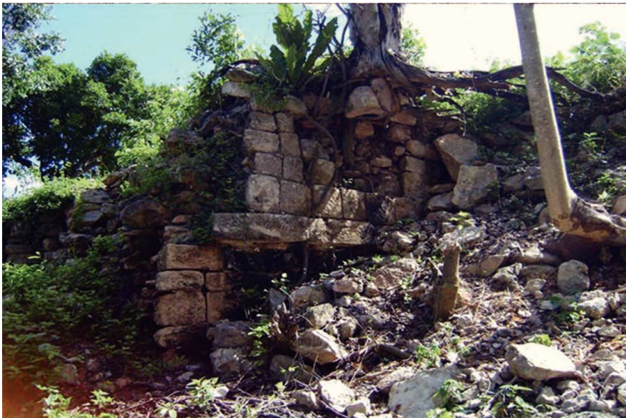
FIGURA 4. Muro poniente del cuerpo inferior de la estructura 1. Arriba: estado de conservación en la década de 1980. Abajo: estado actual después de colapsar.