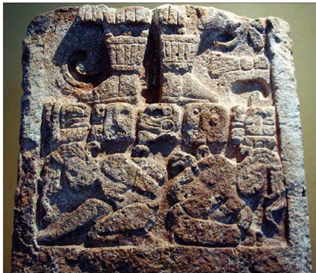
FIGURA 10. Estela 1 de Dzilam González.