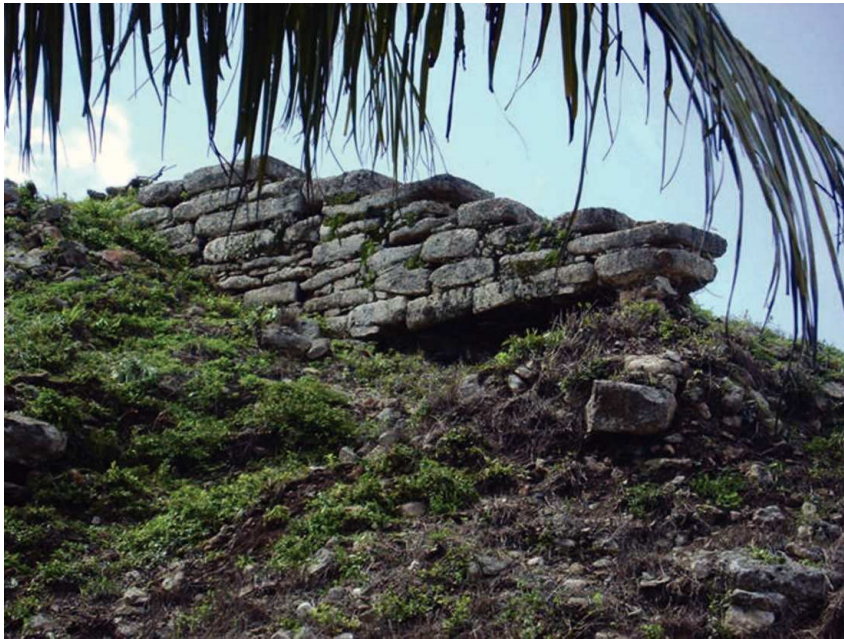
FIGURA 6. Alfarda norte de la fachada poniente de la estructura 2.