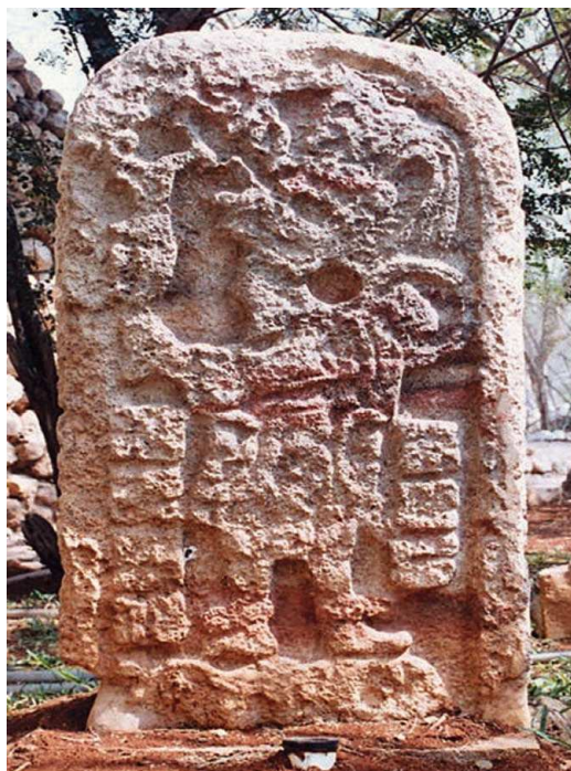
FIGURA 11. Estela 2 de Dzilam González.