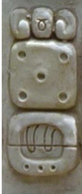
FIGURA 6. Ru-b'i-i rub'i' ("su nombre") en la primera mitad bloque glífico G8 en la estela de Iximche'

sin indicar diferencia alguna, ni por usar glifos innovadores ni por emplear reglas de armonía o desarmonía vocálica (Houston et al. , 1998; Lacadena y Wichmann, 2004). Por ejemplo, se escribe tinamit , "ciudad", "pueblo" como ti-na-mi-ti (bloque glífico A10), con armonía vocálica entre las últimas dos sílabas, donde la palabra kaqchikel tiene la vocal relajada <i>. Pero también se usa el mismo patrón de armonía vocálica en escribir rub'i' , "su nombre", que tiene la vocal tensa final <i>. como ru-b'i-i (p. ej. bloque glífico G8). De la misma manera, las palabras kaqchikeles kaqchikel y qonojel , "todos nosotros", tienen ambas la vocal tensa final <e>, pero se emplean dos variedades diferentes de la desarmonía vocálica al escribir las últimas dos sílabas con los jeroglíficos, -ke-la y -je-li (bloques glíficos D1 y G10), respectivamente.