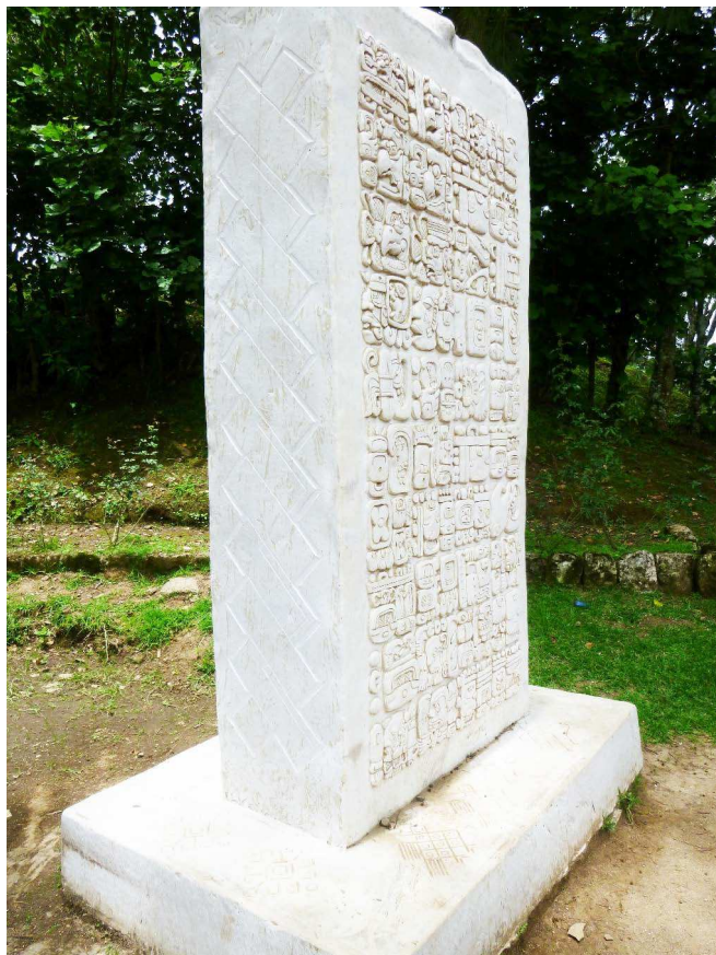
FIGURA 5. La estela de Iximche' con vista del diseño de estera tallado en los lados y en la base

de 4 Ajpu' 8 Kumk'u' , y marca de esta manera la última creación del mundo y el comienzo del ciclo calendárico actual el 11 de agosto de 3114 a.C. 12 El primer número de distancia lleva al lector de la fecha inicial a 11.12.9.13.4, 2 K'at 2 Wayeb' (el 9 de agosto de 470 d.C.), al día de la fundación de Iximche' por cuatro líderes del pueblo kaqchikel. Después se cuentan consecutivamente seis eventos más de la historia de los kaqchikeles: la rebelión entre los kaqchikeles bajo los Tuquche' en 11.13.11.7.13 11 Aj 1 Mol (el 26 de diciembre de 1491); la llegada de los españoles a Iximche' en 11.15.4.4.0 1 Ajpu' 8 K'ank'in (el 24 de abril de 1524);