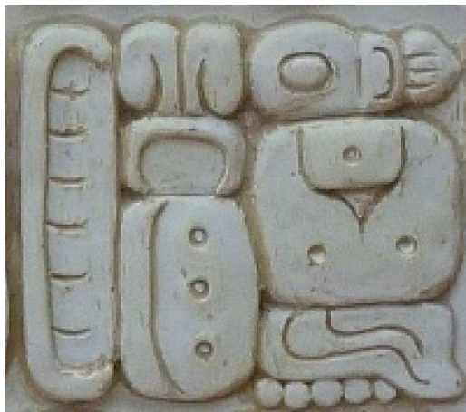
FIGURA 10. Ka-si-ti-la-ni kastilan ("castellano") en el bloque glífico C8 en la estela de Iximche'

Ésta y las otras formas anticuadas sirven para enfatizar la herencia lingüística común de las variedades actuales del kaqchikel, queriendo representarlas como formas únicas y unidas del idioma histórico. Además de representar de forma escrita el pasado lingüístico común de los kaqchikeles, el uso de su forma histórica evita el conflicto entre las variedades de hoy en la revitalización, sobre todo, como ya se apuntó, en lo que toca a la estandarización (p. ej. England, 2003: 738-740), por no elegir usar una forma específica, ya sea la forma estándar, ya otra variante actual, del kaqchikel moderno en el texto. De esta manera, se eligió usar una forma anticuada del idioma, la cual no se habla en ninguna comunidad actual, evitando privilegiar una variedad y marginar a los hablantes de las otras (p. ej. Maxwell, 1996: 205-206). Además, esta forma del kaqchikel se considera hoy en día como variedad representante histórica de sus hablantes como comunidad lingüística unida (Maxwell, 1996: 199). El texto también mantiene la unidad del pueblo kaqchikel, narrando en esta forma histórica una serie de hechos destacados en la historia de todos ellos, desde la última creación del mundo hasta la fundación de su centro político en Iximche' y la celebración del fin del 13° bak'tun .