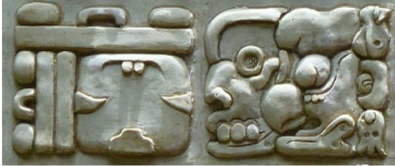
FIGURA 7. Los primeros dos bloques glíficos (E3-F3) de un número de distancia que muestran una alternación entre formas variantes de logogramas en la estela de Iximche'

Como los logogramas en los textos antiguos, los que se encuentran en el texto de Iximche', tienen la ventaja de que el lector puede entender su significado al reconocer la forma gráfica de los mismos sin depender de su lectura fonética y, por tanto, sin necesitar interpretarlos de manera literal o entender el kaqchikel hablado (Sturm, 1996: 121). Por sus posibilidades más amplias de comunicación, los logogramas en el texto de Iximche' asumen un valor simbólico, incluso para los lectores que no entienden el texto en un sentido lingüístico (Amery, 2001: 176-177; Sturm, 1996: 121).