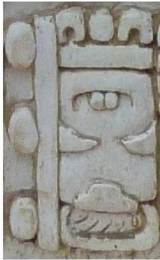
FIGURA 8. WINIK/WINAL-qa winäq (periodo de tiempo de 20 días) en la primera mitad del bloque glífico C10 en la estela de Iximche'

calendáricos, sobre todo si la pronunciación kaqchikel del logograma no corresponde a su pronunciación precolombina. Si bien aparecen unas combinaciones en la estela de Iximche' que figuran en las inscripciones antiguas, como T1000d AJAW con complemento fonético T130 wa para indicar kaqchikel ajaw , “señor”, en el bloque glífico E1, 15 la mayoría de las combinaciones de logogramas con complementos fonéticos en la estela de Iximche' reflejan la identidad kaqchikel del texto. Por ejemplo, T609 ‘libro’ ( HUN en el corpus precolombino) combina con el complemento fonético T88 ji para indicar que corresponde con kaqchikel wuj (bloque glífico H1). De la misma manera, T736v ‘muerte’ ( KAM/CHAM en el corpus precolombino) aparece con T102 ki para señalar la pronunciación de la sílaba final en kaqchikel kamik . Tales combinaciones de glifos no aparecían en los textos antiguos; surgieron como reacción a la necesidad de adaptar la escritura al idioma kaqchikel. Los logogramas indican la adaptación de la escritura jeroglífica recuperada al contexto del idioma kaqchikel en las combinaciones innovadoras de logogramas y complementos fonéticos que no aparecen en los monumentos jeroglíficos antiguos. Además, afirman la posición del idioma kaqchikel como parte de la identidad kaqchikel dentro del pueblo maya.