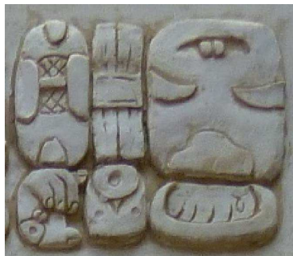
FIGURA 9. CHAK-che-ke-la WINIK/WINAL-qa Kaqchikel winäq (“pueblo kaqchikel”) en el bloque glífico D1 en la estela de Iximche’

Por ser una forma anticuada del kaqchikel, el idioma del texto de Iximche' contiene varias formas que ya no se utilizan en el idioma actual. Una forma importante es la designación misma de kaqchikel , que aparece en el texto jeroglífico como la combinación del logograma T109 “rojo; gran” (CHAK en el corpus precolombino) con los silabogramas che-ke-la (figura 9), las vocales de la cual reflejan las de la forma kaqchekel que aparece junto con la forma actual kaqchikel en Las crónicas de los kaqchikeles (Maxwell y Hill, 2006: Parte II: 26). Además, la referencia a los conquistadores como los kastilan ( ka-si-ti-la-ni ; figura 10), señala la pronunciación de “castellano” en la época colonial (Maxwell y Hill, 2006: Parte II: 256), no la pronunciación kaxlan de hoy (Maxwell y Little, 2006: 17). Entre las formas históricas que no corresponden con las modernas, la más frecuente es la secuencia glífica ru-ma-le . Esta combinación de silabogramas indica la forma histórica rumal de la palabra kaqchikel contemporánea ruma o roma , una forma del sustantivo relacional -uma o -oma que en la estela indica la causa de una acción (p. ej. bloque glífico D5; véase la discusión anterior de -uma y -oma ).