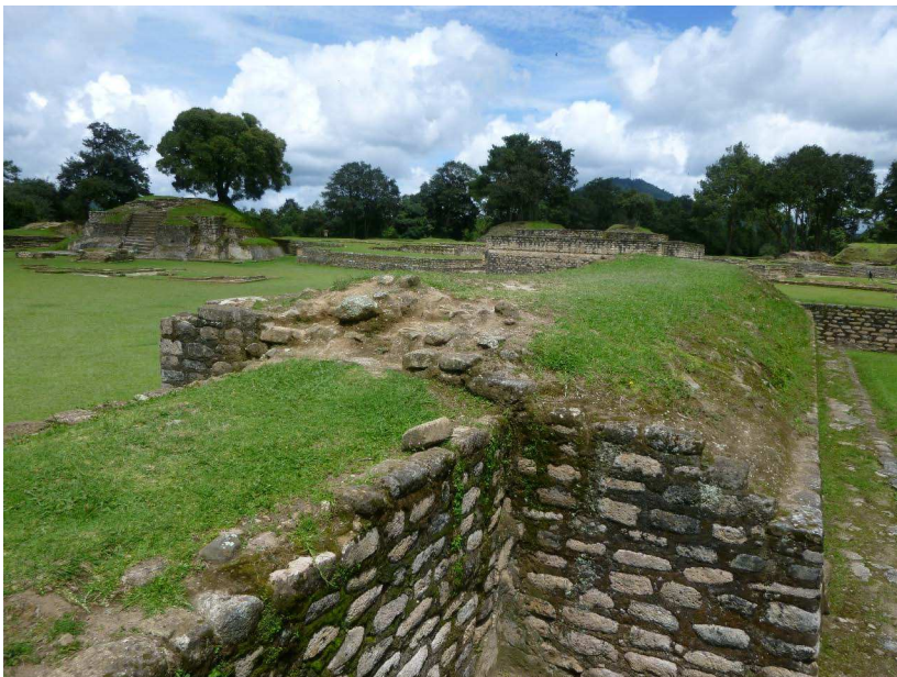
FIGURA 1. El sitio arqueológico de Iximche', Chimatnango, Guatemala