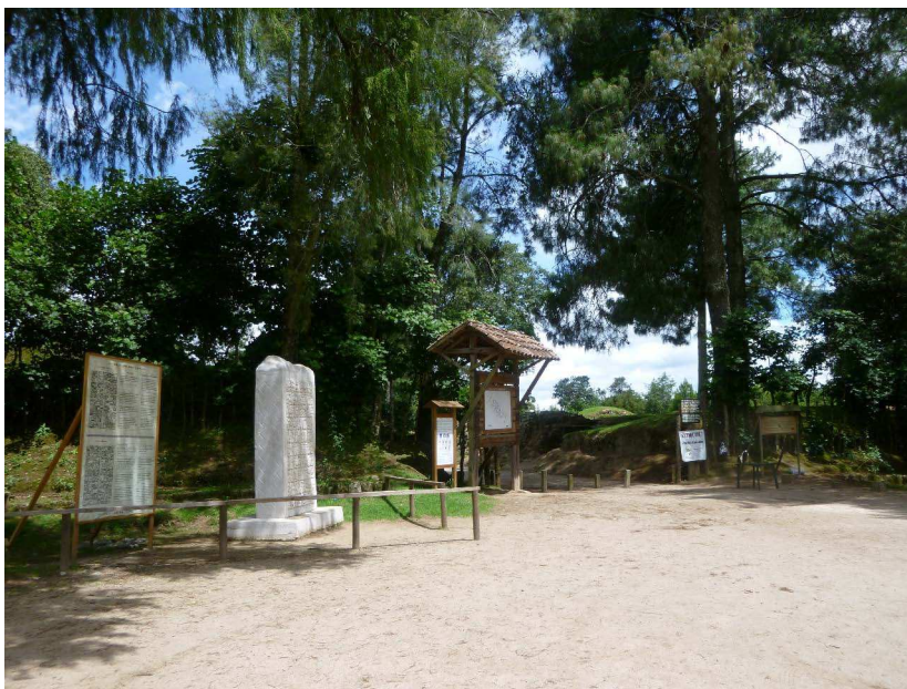
FIGURA 2. Estela moderna y placa con los dibujos, la transcripción y la traducción del texto en la entrada del sitio arqueológico de Iximche'