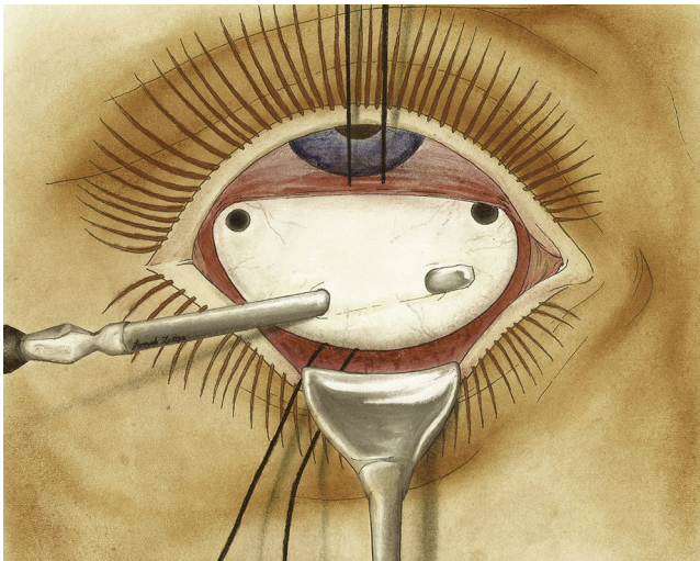
Figura 2 Posteriormente, se vertía solución de potasa o sosa cáustica en las perforaciones esclerales con la intención de crear una «cauterización química» y una cicatriz coriorretiniana alrededor del desgarro.

técnicas: la primera, el abordar con rotación suficiente el globo, sobre todo el lado nasal; a 18 o 20 mm del limbo, un cauterio químico es difícil de aplicar; y la segunda, que la trepanación escleral en membranas delgadas es muy peligrosa, pudiendo perforarse prematuramente la coroides»; en estos casos recomendaba Gonin usar los tornillos de Arruga para taponar las desgraciadas perforaciones.