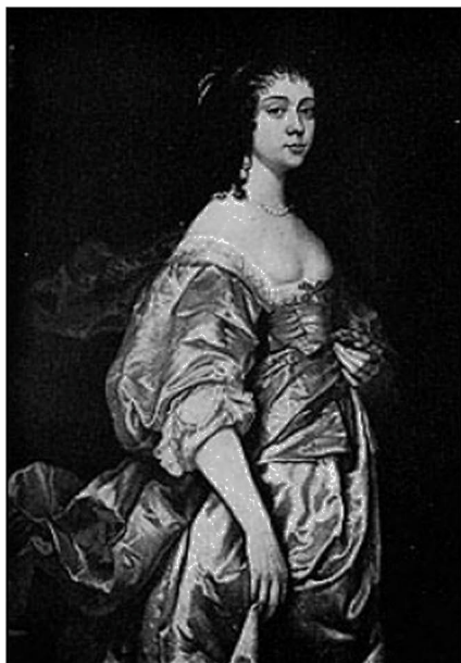
Figura 7. Margaret Cavendish Duquesa de Newcastle. (Tomada de Rayner-Canham, 2009.)

No dejó de escribir a lo largo de toda su vida: loas a sus posibles mecenas, traducciones de su amados clásicos latinos, epigramas de la poetisa griega Safo, escritos reivindicativos de la situación de la mujer. Asimismo hizo varios viajes. Para dedicar su vida al estudio y no tenerse que someter a la autoridad de ningún marido, haciendo frente a los convencionalismos de la época, decidió no casarse.