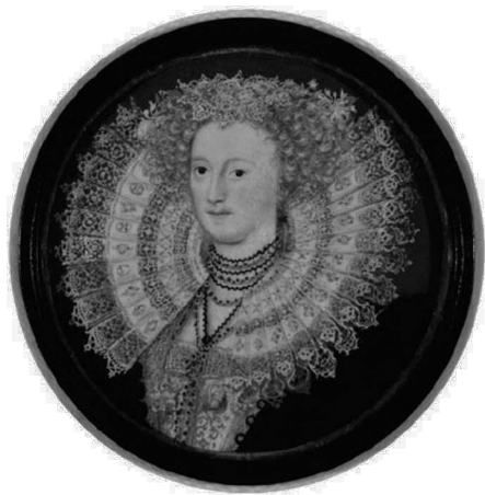
Figura 5. Mary Sydney Herbert, Condesa de Pembroke. Pintada por Nicholas Hilliard alrededor de 1590. National Portrait Gallery, número NPG5994.

Condesa de Pembroke (figura 5). La condesa recibió instrucción en varias materias que se estudiaban en esa época, tales como la lengua, poesía, música y tejido, así como en otras más inusuales tales como estudios de embriología, medicina y química. Su biógrafo, John Aubrey, anota: