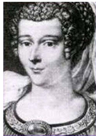
Figura 6. Marie le Jars de Gournay.

Buscó siempre el patrocinio de la familia real, pero pasó años viviendo en la pobreza.