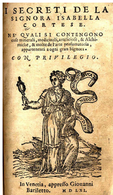
Figura 4. Edición de libro de Isabella Cortese de 1561.

ción de su escrito, redactado en el lenguaje críptico característico de este tipo de textos: