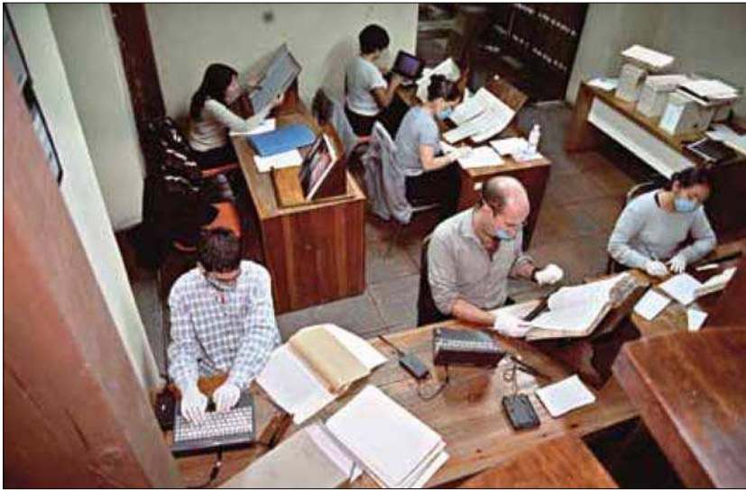
Figura 2. Sala de consulta del Archivo Histórico del Distrito Federal, el autor de estas líneas se localiza a mano derecha y al centro.

en el papel se pueden apreciar tenues manchas, más o menos uniformes, lo que denota que en algún momento se escribió con tinta en ellas, pero ésta se evaporó, sin que el papel se afectara, lo que atribuyo a las condiciones climáticas. Afortunadamente, en la actualidad este archivo se encuentra en una habitación con aire acondicionado. Este recinto, por cierto, recibe muy pocos investigadores, llegando a ser por varios días el único individuo consultando.