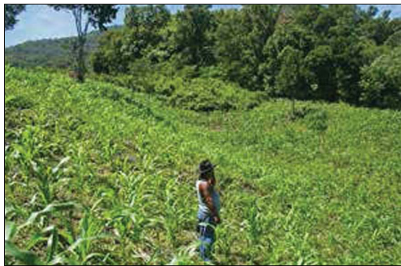
Figura 3. Kila y el trabajo chatino. Autor: Gerónimo Barrera de la Torre, archivo de campo, julio de 2014.

Como hemos descrito, dentro del trabajo de campo se incorporaron técnicas cercanas a la