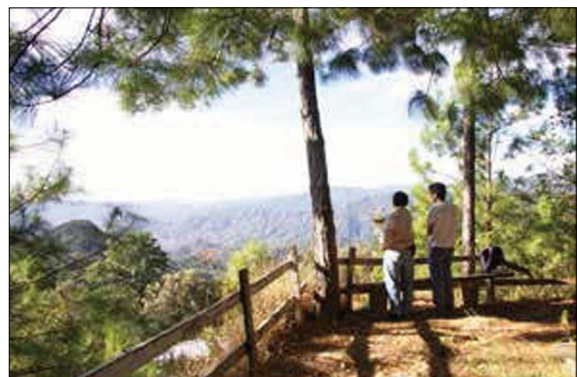
Figura 1. Reflexiones en torno al paisaje Chatino. Autor: Gerónimo Barrera de la Torre, archivo de campo, enero de 2015.

Como he mencionado, la investigación tuvo como objetivo central aproximarse a la relación del pue-