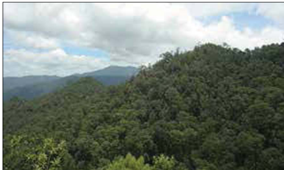
Figura 5. Cerros, montañas y bosques. Recorrido por K'qya-c stanq-a (“Cerro de Rama”). Autor: Gerónimo Barrera de la Torre, archivo de campo, agosto de 2014.

Considero pertinente terminar este texto remarcando la importancia de dar continuidad al trabajo