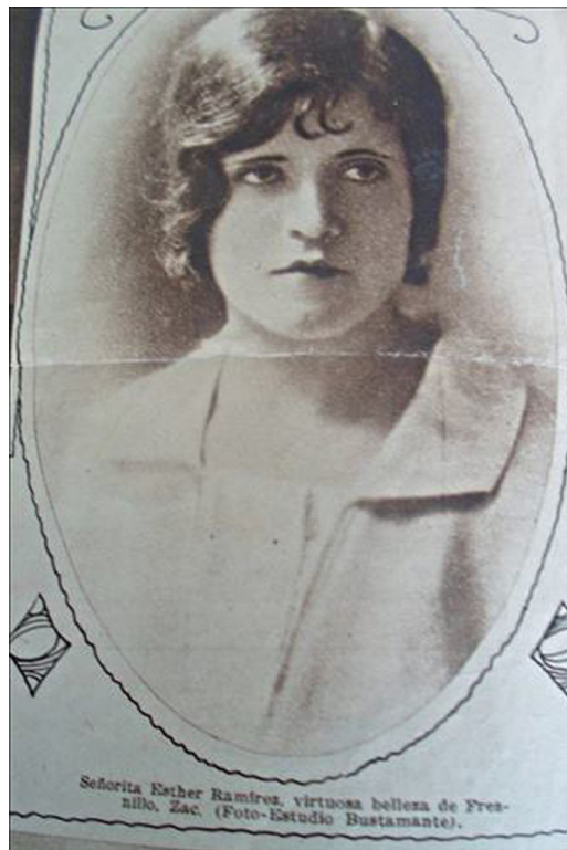
Figura 21. De carne y hueso ( El Monitor , 17/05/1931, p.2).

Finalizamos con reflexiones de Rosario Castellanos que adecúan o justifican la utilización de las fuentes hemerográficas para una reconstrucción histórica: