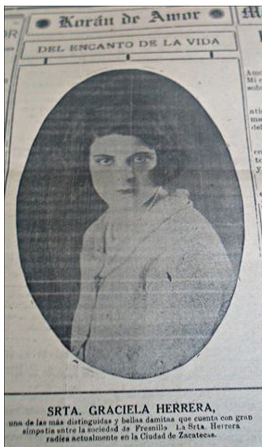
Figura 22. Bellas y virtuosas ( El Monitor , 24/05/1931, p.2).