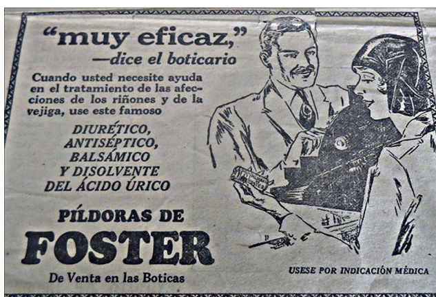
Figura 13. Modelos masculinos y femeninos ( Orientación , 07/02/1928, p.3).