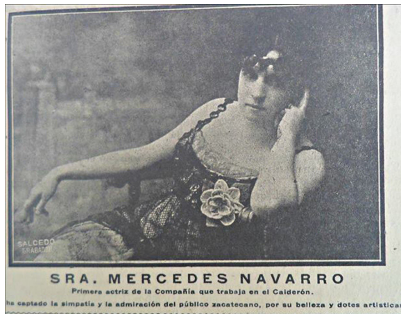
Figura 10. Se utiliza la fotografía ( El Heraldo , 11/08/1918, p.4).