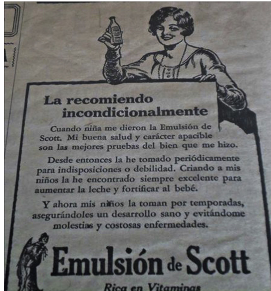
Figura 16. Modelos de mujeres ( Orientación , 30/03/1929, p.3).

ciables. El cuerpo de las mujeres es un cuerpo sujeto y ellas encuentran fundamento a su sometimiento en sus cuerpos, pero también su cuerpo y su sexualidad son el núcleo de sus poderes.