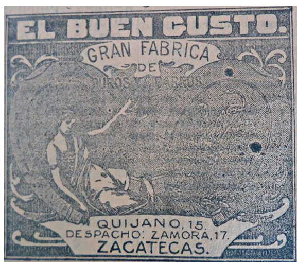
Figura 12. La mujer objeto y símbolo ( Periódico Opinión , 31/10/1920, p.4).