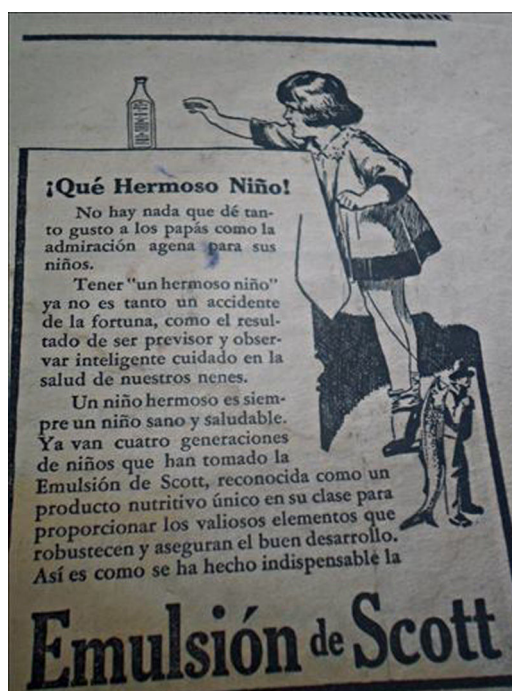
Figura 14. Medicina para niñas/os ( Orientación , 15/02/1928, p.3).

De esta manera, la publicidad fue tomando como objeto principal el cuerpo femenino para ofrecer todo tipo de productos: para el hogar, la familia, los caballeros o para ellas mismas. Las mujeres promocionaban medicamentos, productos de limpieza individual, para el hogar, alimentos, bebidas y más. Como dice Marcela Lagarde: