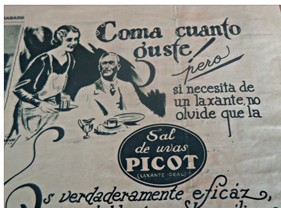
Figura 17. Estereotipos: femeninos/masculinos ( Orientación , 30/03/1929, p.3).