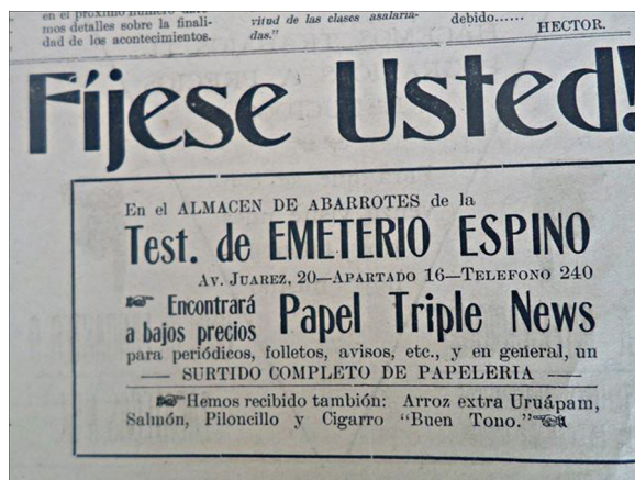
Figura 1. Publicidad para caballeros ( El Heraldo , 18/08/1920, p.4.).