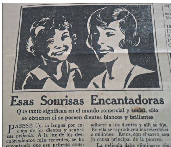
Figura 20. Estereotipos femeninos ( Orientación , 07/04/1930, p.4).

hace una breve descripción de la ciudad de Zacatecas y algunos de sus pueblos aledaños, así como la destrucción que ocurrió con la toma de Zacatecas en 1914, y en cómo la población se recuperó y se ayudó mutuamente para la reconstrucción. Los últimos versos dicen: