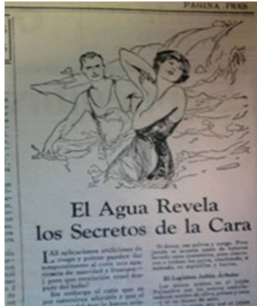
Figura 19. Cuerpo-objeto ( El Monitor , 17/01/1931, p.5).

histórico-social, ya que su subjetividad ha sido reducida y aprisionada dentro de una sexualidad esencialmente para otros, con la función específica de la reproducción (Basaglia, citada por Lagarde, 2014, p. 200).