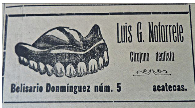
Figura 8. Avanza la publicidad ( Opinión , 20/09/1920, p.4).