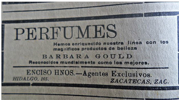
Figura 6. Publicidad para mujeres ( Opinión , 20/09/1920, p.4).