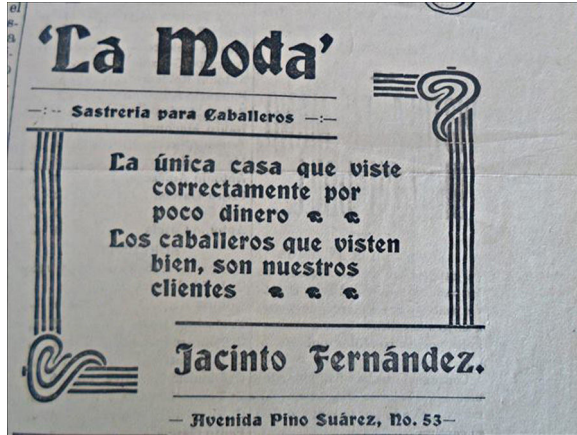
Figura 5. Publicidad para caballeros ( El Heraldo , 11/08/1920, p.4).