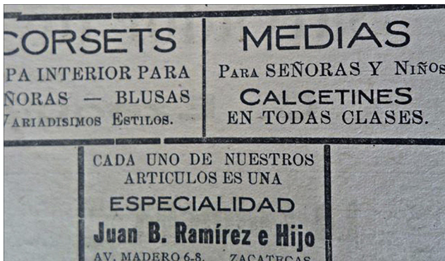
Figura 7. Se considera a las mujeres ( Opinión , 27/02/1920, p.4).