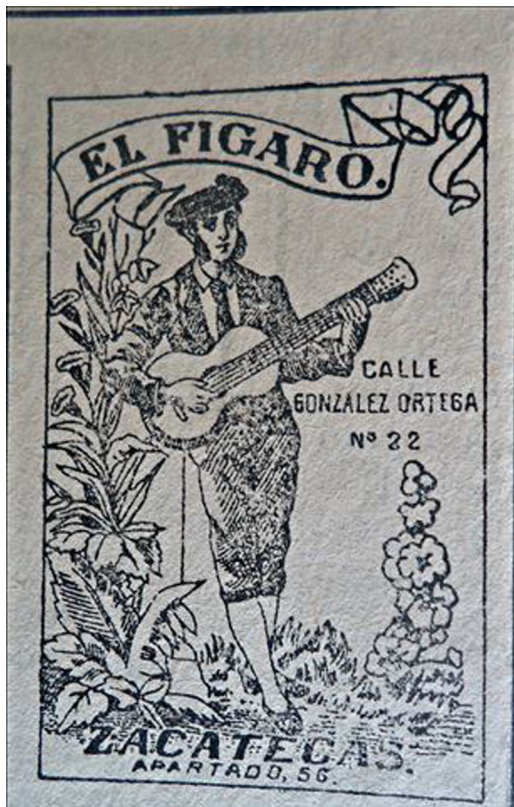
Figura 11. El figaro ( Periódico Opinión , 20/09/1921, p.4).