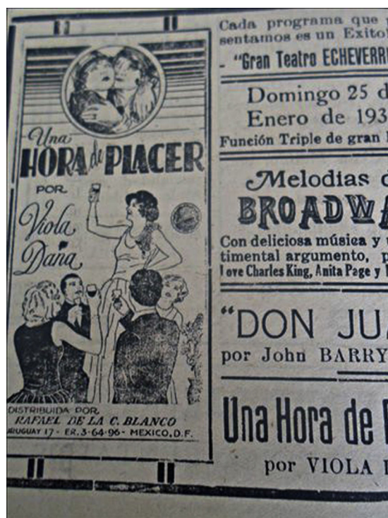
Figura 18. Ellas: objetos de placer ( El Monitor , 17/01/1931, p.5).

conservar ese esplendor y galanura y a servir gustosas a los deseos de los otros (figs. 18 y 19), con un cuerpo que les pertenece y a la vez no, pues, como señala Franca Basaglia: