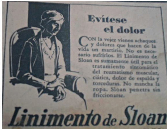
Figura 15. La tercera edad ( Orientación , 21/02/1928, p.3).