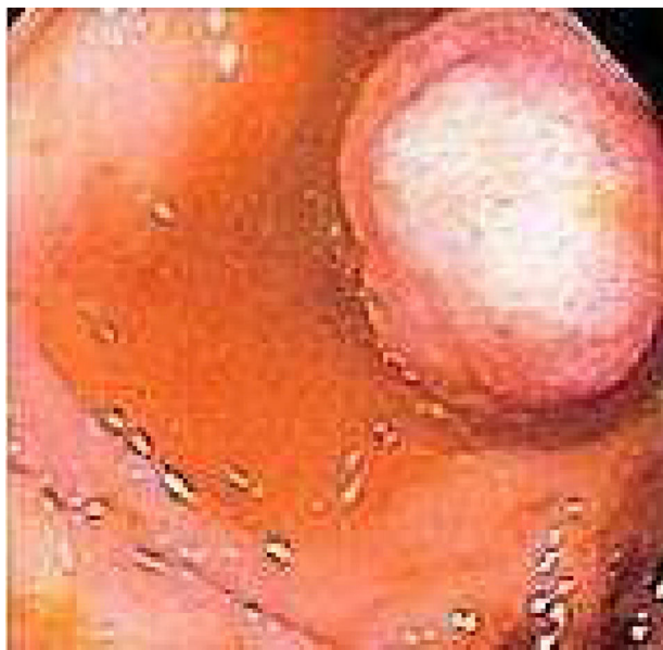
Figura 3 Enteroscopia de doble balón. Pólipo fibroso inflamatorio.

Existen varias hipótesis patogénicas pero se desconoce su etiología, aunque la mayoría de autores destacan su probable origen reactivo. Es una entidad rara (probablemente infradiagnosticada), habiendo sido publicados unos 200 casos. Predomina en el sexo masculino y se diagnostica con más frecuencia en la 5. a y 6. a décadas de la vida 9 .