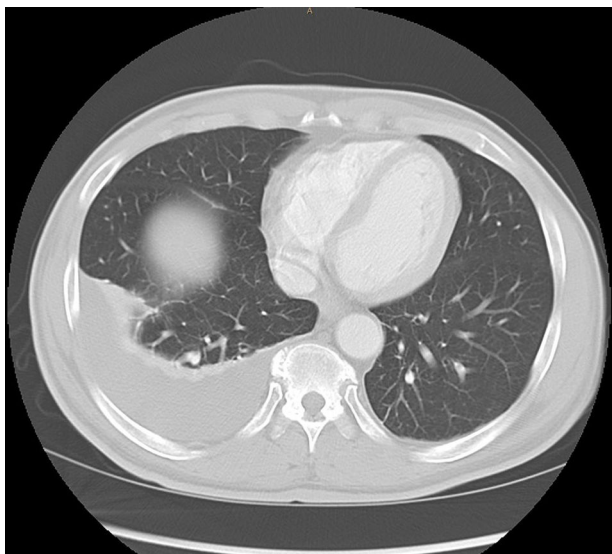
Figura 2 Derrame pleural derecho.

anteriormente descrito, resulta difícil establecer una relación causal con el tratamiento con AAD o simplemente se trata de una coincidencia en el tiempo de las 2 infecciones. Se trataría del segundo caso de reactivación de TBC durante el tratamiento con AAD. La baja incidencia de casos de reactivación de TBC con los AAD reportada hasta el momento, no permite realizar recomendaciones sobre su cribado antes de iniciar el tratamiento.