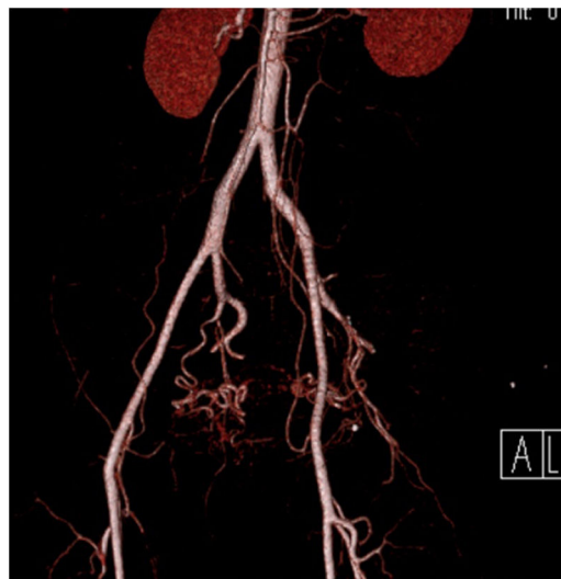
Figura 1 Angiotomografía con reconstrucción 3D, donde se observan las arterias iliacas internas (hipogástricas), con un aproximado de 3 a 4 cm de largo, con dos ramas: un tronco anterior y un tronco posterior.

Veinticuatro horas posteriores al procedimiento quirúrgico se realizó nueva tomografía computarizada (TC), logrando observar ausencia total de vascularidad en el trayecto de la iliaca interna, así como de su tronco anterior y región distal, observándose discreta permeabilidad por la circulación colateral (fig. 2).