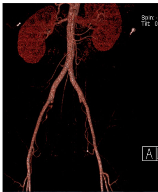
Figura 2 Angiotomografía con reconstrucción en 3D, posterior a ligadura de las arterias hipogástricas (ligadura proximal y tronco posterior bilaterales).

La paciente evolucionó favorablemente, presentando únicamente parestesias de miembro inferior derecho de manera transitoria, sin pérdida de tono, fuerza, ni alteraciones en la marcha.