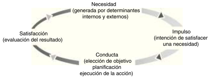
Figura 1. Modelo de organización de las conductas dirigidas a objetivos.

motivación, que persiste en el tiempo y produce efectos negativos identificables respecto al nivel de funcionamiento previo del sujeto, su grupo de edad y su estrato cultural 3 . La sintomatología no sería atribuible a una disminución del nivel de conciencia, deterioro cognitivo o trastorno depresivo. La conducta dirigida a un fin consiste en el conjunto de procesos interrelacionados (motivacionales, emocionales, cognitivos y motores) por los que un estado interno se traduce en la consecución de un objetivo, existiendo una continua evaluación y corrección del resultado (fig. 1). El objetivo puede ser inmediato y de índole física, como aliviar la sed, o a largo plazo y abstracto, como tener éxito en el trabajo o lograr la felicidad.