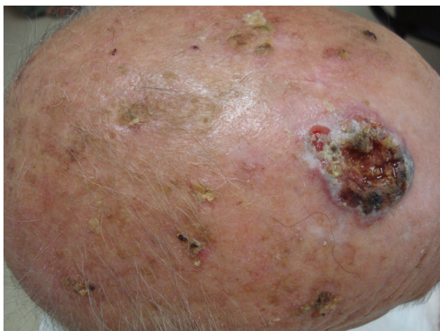
Figura 1 Campo de cancerización con carcinoma epidermoide.