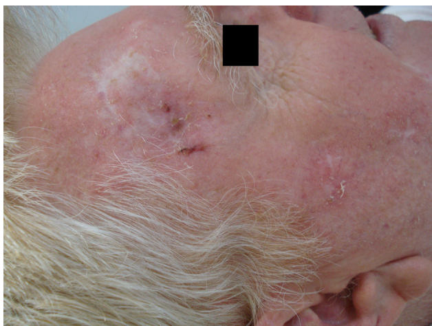
Figura 2 Resolución completa en días.

a Eficacia evaluada en función de la duración del tratamiento (uno o más ciclos).