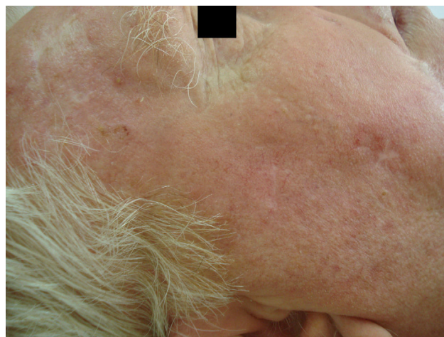
Figura 4 Múltiples queratosis actínicas previas al tratamiento.