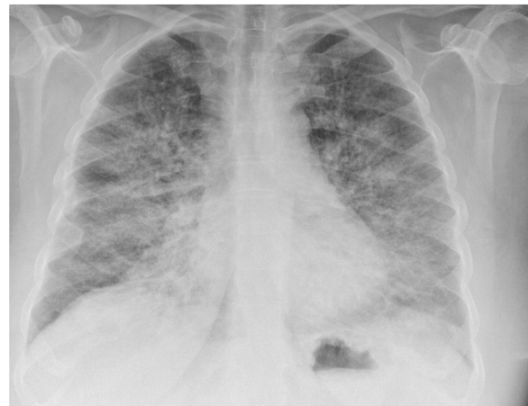
Figura 1 Radiografía de tórax: ICT normal. Infiltrado alveolo-intersticial bilateral de predominio en base derecha de cronología aguda.

Vuelve a consultar por empeoramiento de su disnea habitual de un día de evolución. Dicho cuadro aparece después de mezclar varios productos de limpieza (refiere combinar en un cubo lejía, amoníaco, en menor cuantía sulfamán [ácido clorhídrico] y otros productos químicos) con objeto de desinfectar las paredes y superficies de su domicilio). Se justifica explicando que, en las noticias, de forma continua se indicaba la necesidad de desinfectar las superficies para prevenir el coronavirus. La paciente ha realizado esta mezcla sin airear su domicilio, manteniéndolo cerrado durante el proceso de desinfección (según nos indica ha desinfectado su casa en otras ocasiones, con los mismos químicos, mejorando su ansiedad al contagio). No obstante, en el momento actual, se ha visto que la desinfección de superficies no es un elemento primordial para la prevención de la COVID-19, sin embargo, la aireación de las superficies si es un elemento cardinal para su prevención 3 .