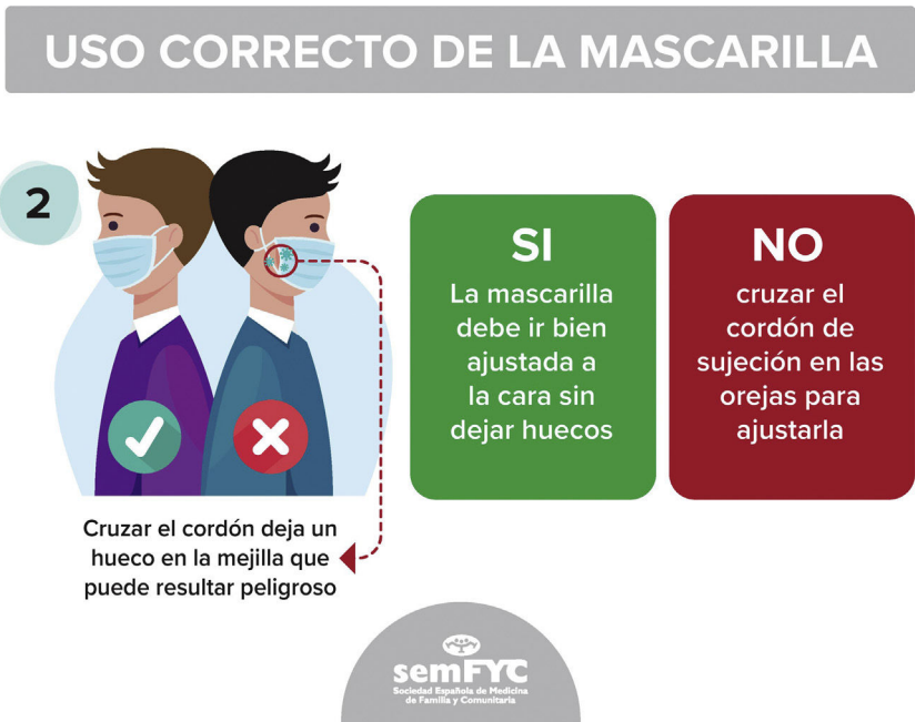
Figura 5 Uso correcto de las mascarillas.