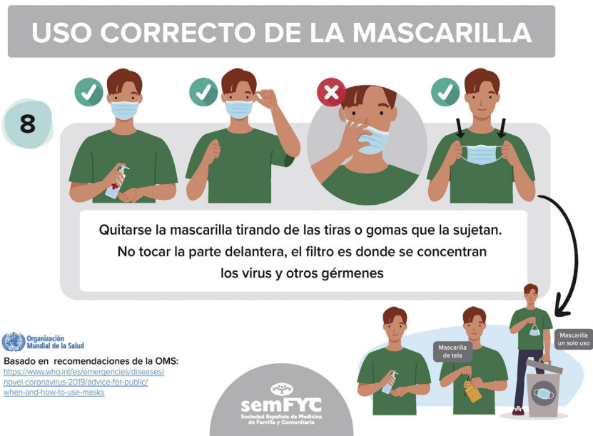
Figura 6 Uso correcto de las mascarillas.