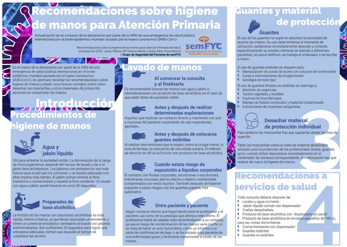
Figura 2 Recomendaciones sobre la higiene de las manos para Atención Primaria de Salud.