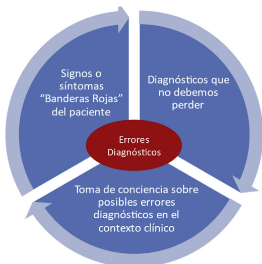
Figura 3 Las tres áreas clave para un diagnóstico seguro.

tener presentes los diagnósticos que no debemos perder y ser conscientes de los potenciales EEDD en el contexto clínico en el que trabajamos. En la intersección de potenciales fallos en estas tres áreas surgirían los EEDD, como se detalla en la figura 3 . El uso de las herramientas de apoyo al proceso diagnóstico es particularmente útil para los profesionales sanitarios en formación, de tal forma que consoliden una metodología de trabajo clínico consciente de la gestión de riesgos en el proceso diagnóstico.