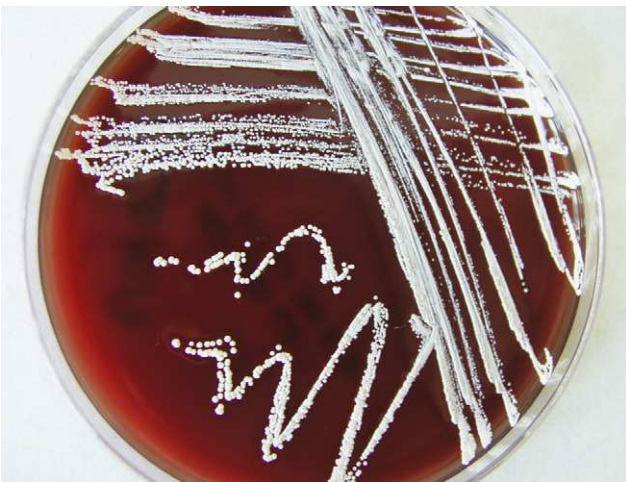
Figura 2. Morfología de Nocardia asteroides en agar sangre.

filogenética molecular, principalmente de las secuencias del gen 16SrDNA 2 . El género Nocardia incluye más de 50 especies. Son patógenos oportunistas, por lo que, causan infecciones en pacientes con déficit de inmunidad celular. Su distribución es mundial, se encuentran en la tierra, material vegetal en descomposición y ambientes acuáticos, se pueden suspender en el aire como partículas de polvo. La inhalación es el mecanismo más frecuente de adquisición pero existen otros modos de infección como la