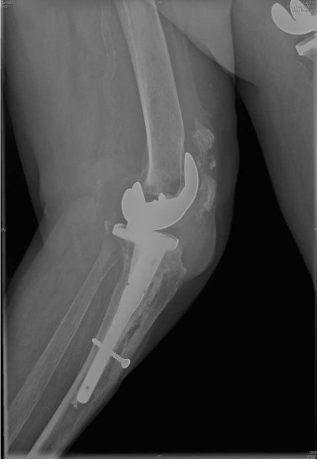
Figura 1. Radiografía de la rodilla izquierda.