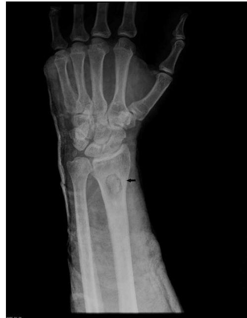
Figura 1. Radiografía anteroposterior de antebrazo izquierdo. Se aprecia una lesión radioluciente de márgenes bien definidos en la metáfisis del radio (flecha).

El absceso de Brodie, descrito por primera vez en 1832, es un tipo de osteomielitis subaguda o crónica paucisintomática que afecta