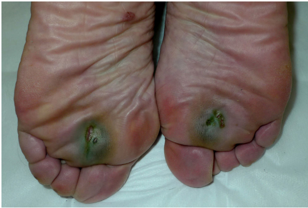
Figura 1. Úlceras plantares de localización bilateral y simétrica de coloración verdosa.