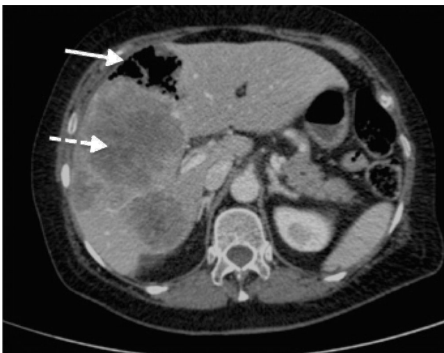
Figura 2. TC de abdomen con contraste intravenoso, plano axial. Lesiones hepáticas metastásicas múltiples (flecha discontinua), una de ellas abscesificada con gas en su interior (flecha continua).