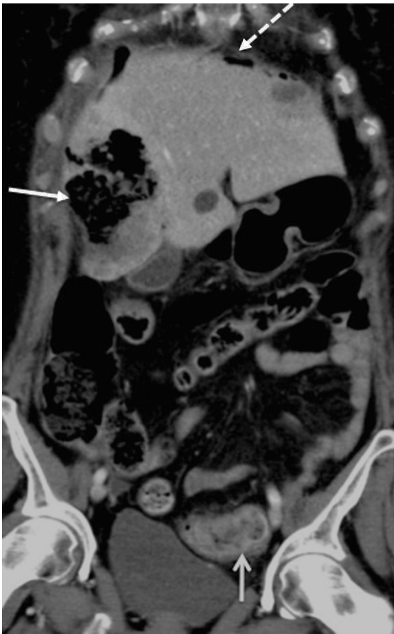
Figura 1. TC de abdomen con contraste intravenoso, plano coronal oblicuo. Metástasis hepática necrosada y abscesificada (flecha continua cabeza cerrada) complicada con neumoperitoneo (flecha discontinua) y asociado a un engrosamiento neoplásico en sigma (flecha continua cabeza abierta).