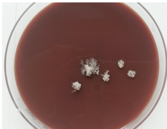
Figura 2. Colonias cerebriformes de T. verrucosum en agar chocolate tras 10 días de incubación a 37 °C.

En los cultivos de exudado, absceso y biopsia de la lesión de la rodilla se observa a los 7-10 días de incubación el crecimiento puro de un hongo filamentososo que forma colonias cremosas cerebriformes en medio de agar chocolate y agar sangre a 37 °C (fig. 2), por lo que se suspende el tratamiento antibiótico y se pauta tratamiento con terbinafina oral. Días más tarde se observa crecimiento en medio de Sabouraud con cloranfenicol y gentamicina a 30 °C. En el examen microscópico se observan hifas en candelabro, ausencia de macroconidias y microconidias, y la presencia de cadenas largas de clamidoconidias compactadas sugestivas de Trichophyton verrucosum (fig. 3). El estudio histológico demuestra un proceso inflamatorio en la dermis con destrucción folicular y presencia de estructuras redondeadas PAS positivas, compatible con granuloma de Majocchi. Después de 6 semanas de tratamiento, la lesión de la tibia derecha progresa hacia un cuadro de celulitis con pequeñas lesiones pustulosas y signos de linfangitis. En el cultivo de una de las lesiones se aísla de nuevo T. verrucosum , cuya identificación se confirma mediante la secuenciación de la región ITS del ARNr. Finalmente, tras 12 semanas de tratamiento con terbinafina 250 mg/d, la totalidad de las lesiones desaparece y el paciente es dado de alta sin alteraciones en los controles analíticos.