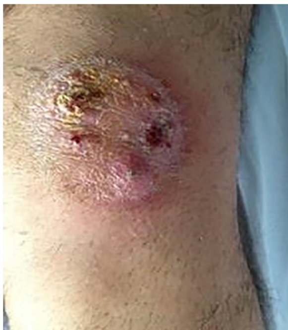
Figura 1. Lesión de bordes descamativos y sobreinfección en la rodilla izquierda.

Paciente de 42 años, sin antecedentes médicos de interés que acude al hospital por presentar una lesión cutánea en la extremidad inferior izquierda y sensación distérmica. Refiere la aparición, 2 meses antes, de una placa eritematodescamativa no pruriginosa en la rodilla izquierda. En la exploración se observa una placa redondeada de bordes descamativos sobreinfectada en la cara lateral de la rodilla izquierda con varios puntos abscesificados, así como signos de celulitis y linfangitis en el muslo (fig. 1). Presenta varias adenopatías duras, móviles y dolorosas en la región inguinal izquierda. El paciente vive en el campo en contacto con vacas, cabras y caballos, y refiere una caída de un caballo sobre unas zarzas. Tras pautar tratamiento iv con amoxicilina-clavulánico, el paciente ingresa en la unidad de enfermedades infecciosas, donde se plantea el diagnóstico diferencial de infección por micobacterias vs. nocardiosis y se realiza una biopsia de la lesión para su estudio histológico y microbiológico. Asimismo, en la zona pretibial derecha se aprecia una